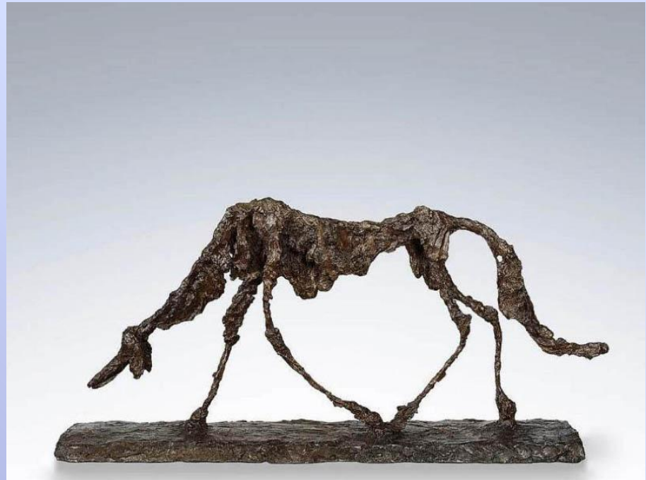
Альберто Джакометти «Собака», бронза 1951 год