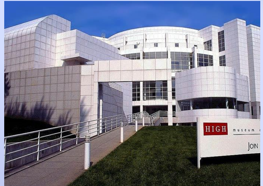
Музей прикладного искусства, Роберт Майер, США, Атланта