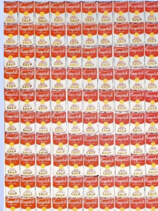
Энди Уорхол «100 банок с супом»