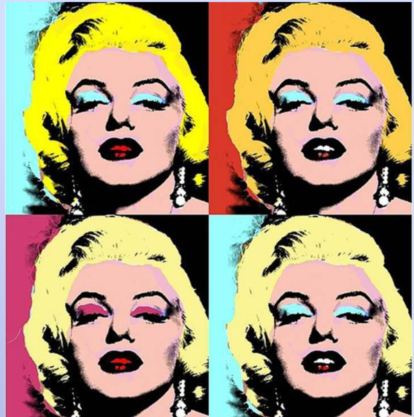
Энди Уорхол «Мэрилин Монро»