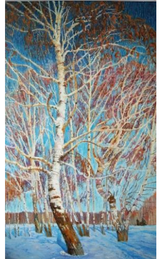
И. Грабарь: Февральская лазурь