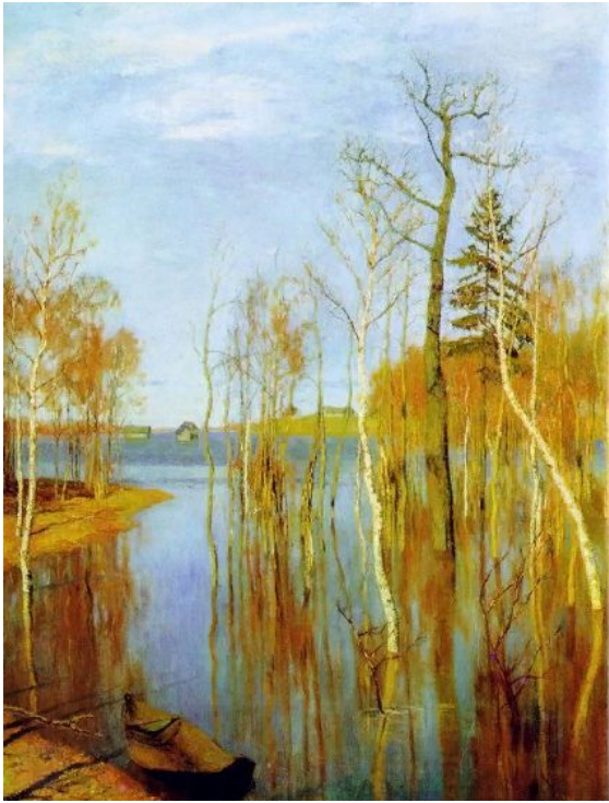
И.И. Левитан: Весна. Большая вода