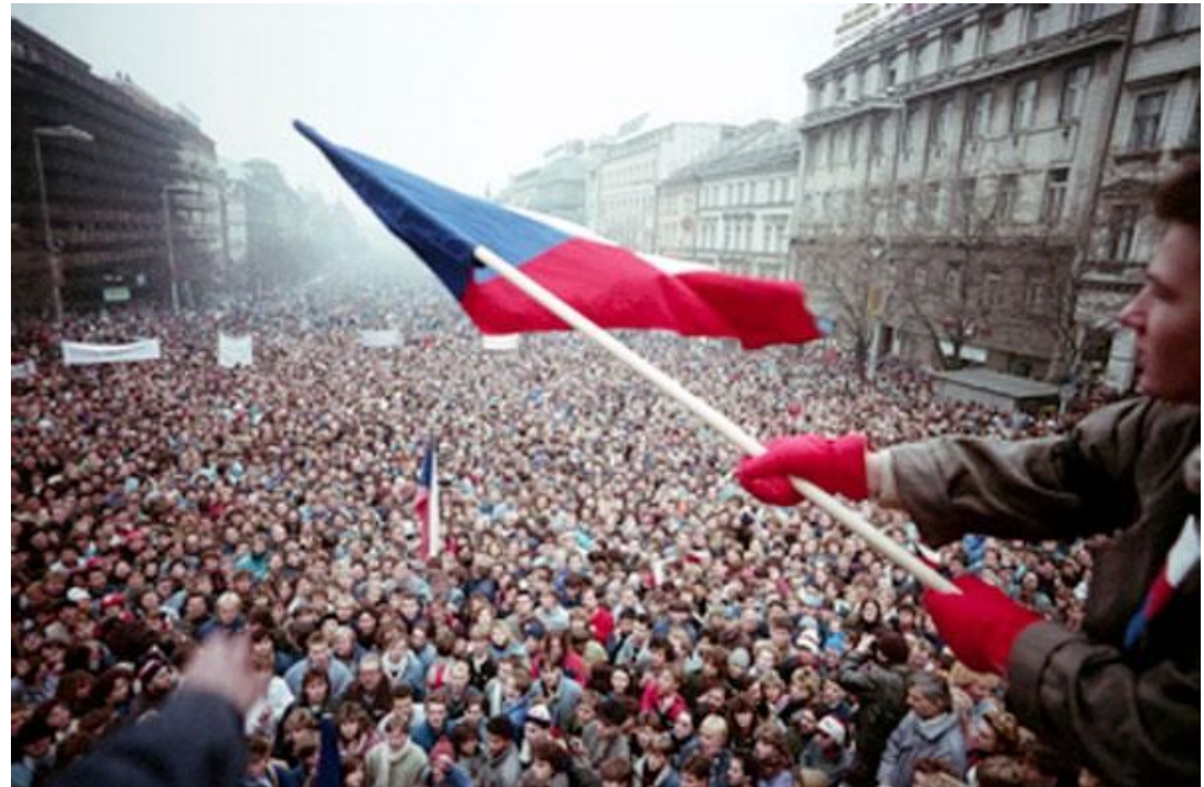
Бархатная революция в Чехословакии.