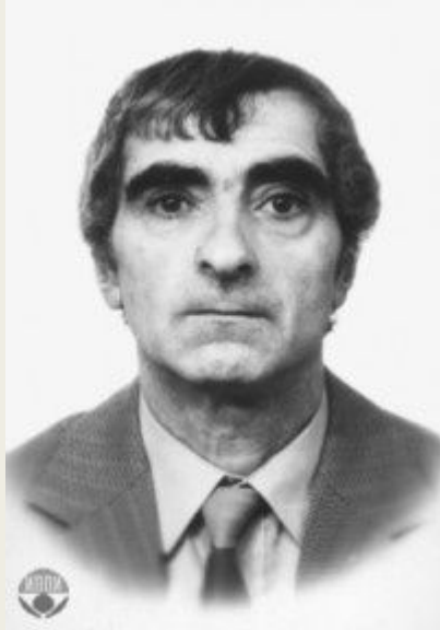
Правовед В.С. Нерсисянц