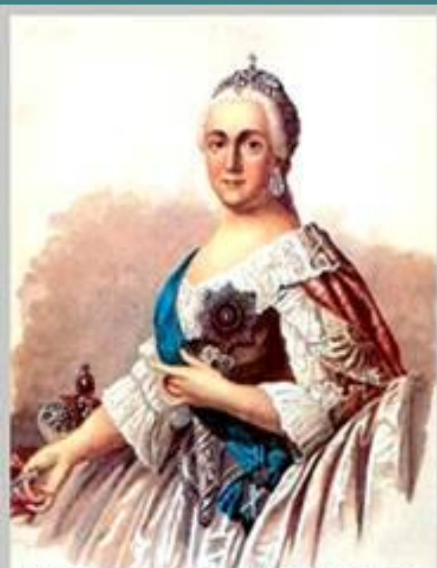
Екатерина II Алексеевна (Великая) (1729-1796)