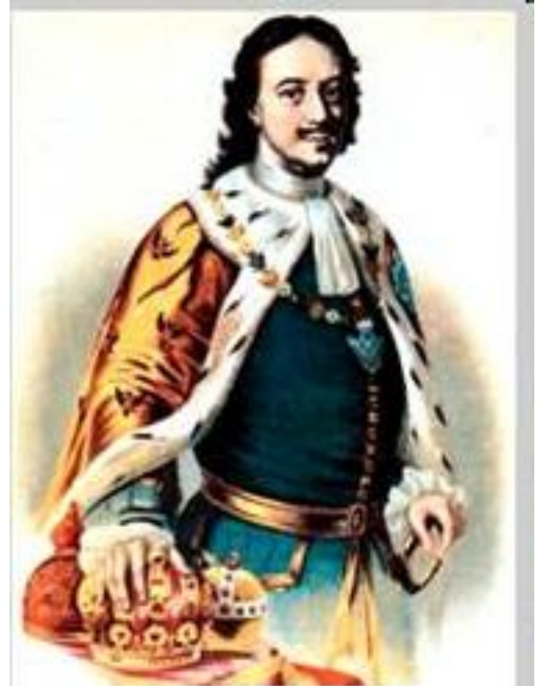
Петр I Алексеевич (Великий) (1672-1725)