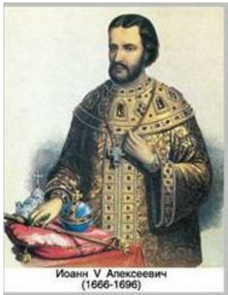
Иоанн V Алексеевич (1686-1696)