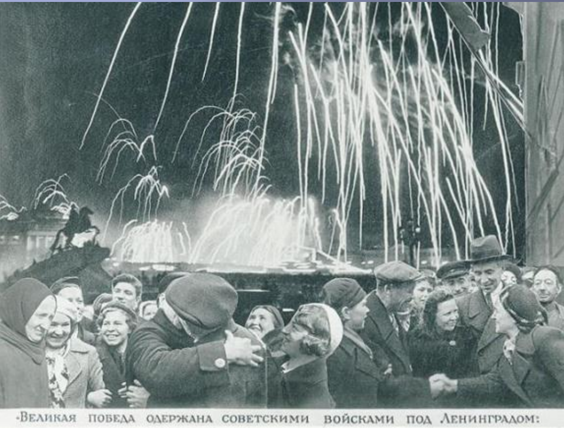
-Великая победа одержана советскими войсками под Ленинградом:

27 января 1944 года Ленинград салютовал 24 залпами из 324 Орудий в честь полной ликвидации вражеской блокады- разгрома немцев под Ленинградом.