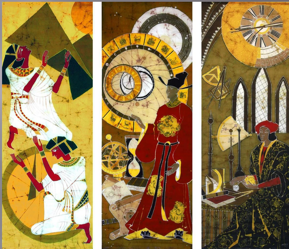
ТРИПТИХ «РАЗНИЦА ВО ВРЕМЕНИ» («ЕГИПЕТ – СОЛНЕЧНЫЕ ЧАСЫ», «КИТАЙ – ПЕСОЧНЫЕ ЧАСЫ», «СРЕДНЕВЕКОВЬЕ – МЕХАНИЧЕСКИЕ ЧАСЫ») Период и место создания: г. Москва, 2010 г. Материал, техника: ткань хлопчатобумажная, роспись ручная, горячий батик.