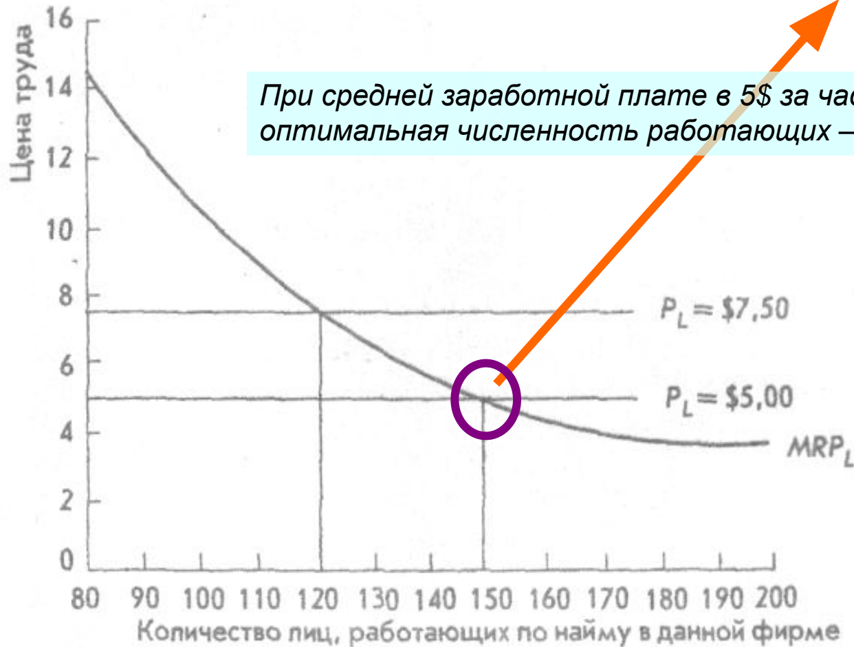
Рис. 10.2. Спрос фирмы на труд (рабочую силу), выраженный в виде зависимости величины предельного продукта (труда) в денежной форме от количества работающих