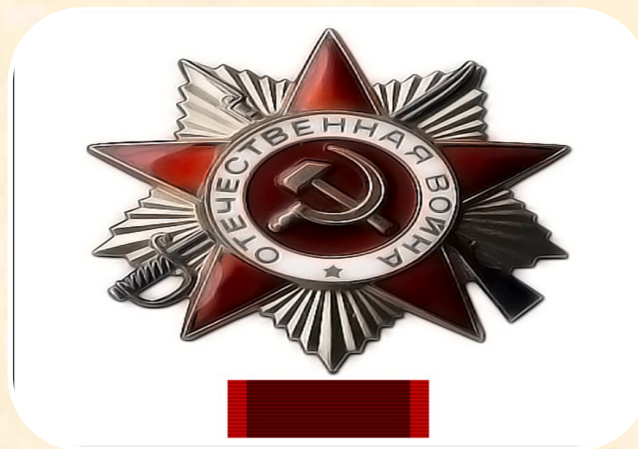
Орден «Отечественной войны 2 степени