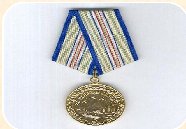
Медаль «За оборону Кавказа»