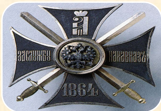
Крест «За службу на Кавказе»