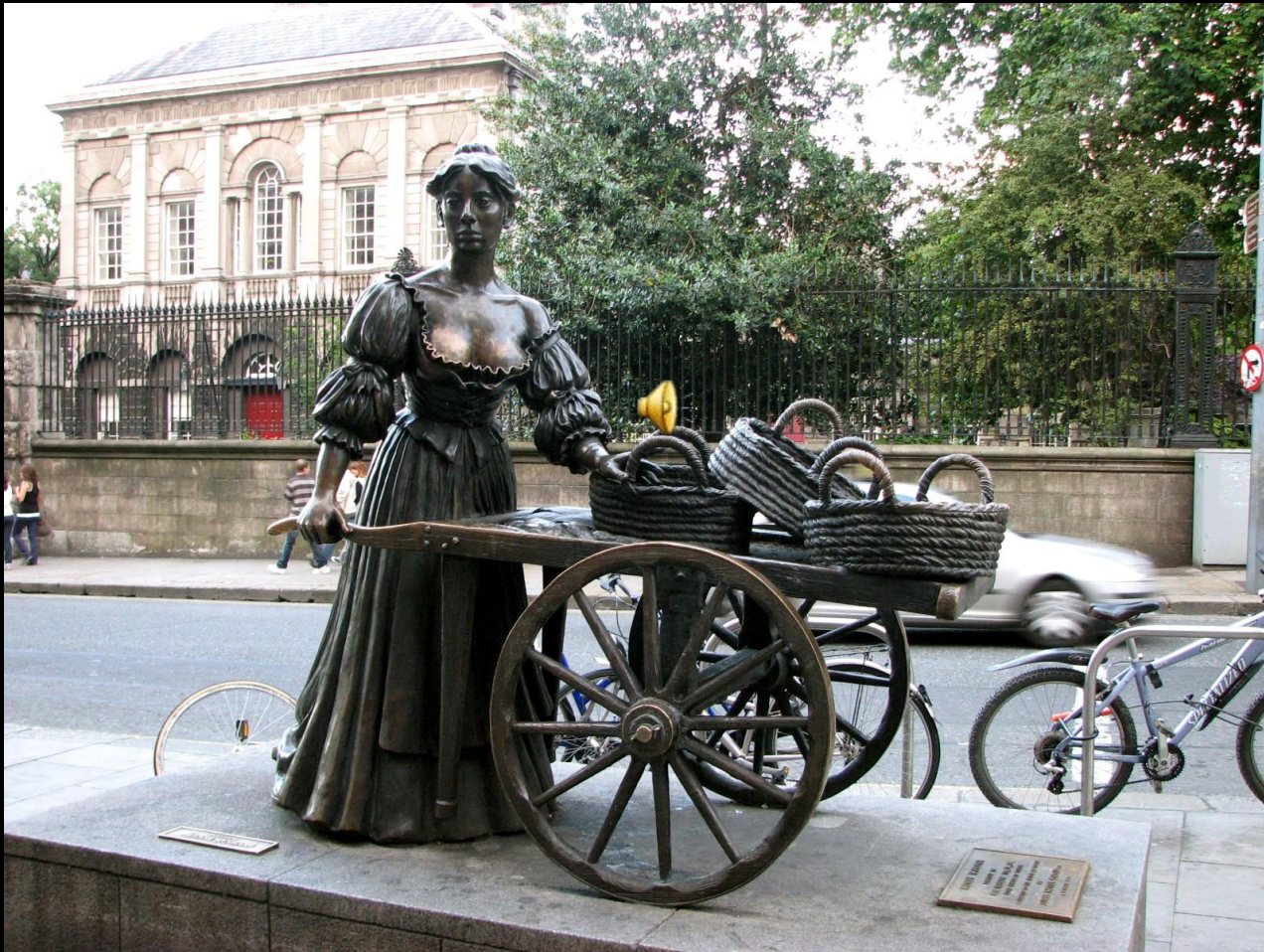
Cockles and Mussels (Herzmuscheln und Miesmuscheln)