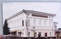
МУЗЕЙ СОВРЕМЕННОГО ЭТНОКУЛЬТУРЫ