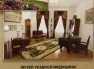
МУЗЕЙ УЗЕДНОЙ МЕДИЦИНЫ ИМ. В.М. ВЕКТЕРОВА