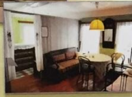
ДОМ ПАМЯТИ М.И. ЦВЕТАЕВОЙ