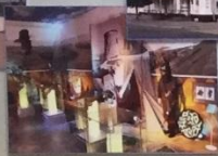
МУЗЕЙ ИСТОРИИ ГОРОДА