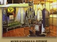
МУЗЕЙ-УСАДЬБА Н.А. ДУРОВОЙ