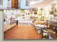
МУЗЕЙНЫЙ МАГАЗИН «ХУДОЖЕСТВЕННЫЙ САЛОН»