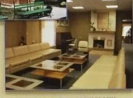
БИБЛИОТЕКА СЕРЕБРЯНОГО ВЕКА