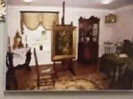
МЕМОРИАЛЬНЫЙ ДОМ-МУЗЕЙ И.И. ШИШКИНА