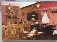
МУЗЕЙ ТЕАТР «ТРАКТИР»