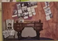
ЛИТЕРАТУРНЫЙ МУЗЕЙ М.И. ЦВЕТАЕВОЙ