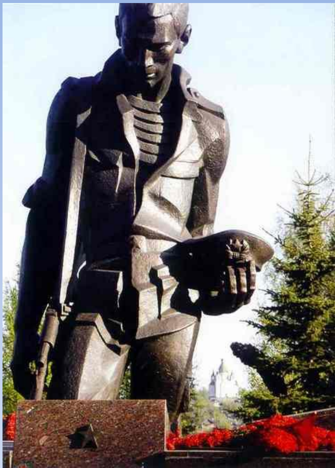
Мемориал памяти воинов, погибших в Афганистане. Нижний Тагил