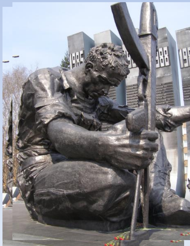
Мемориал в Екатеринбурге