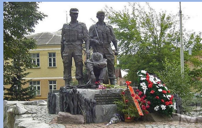
Памятник воинам – афганцам в Киеве