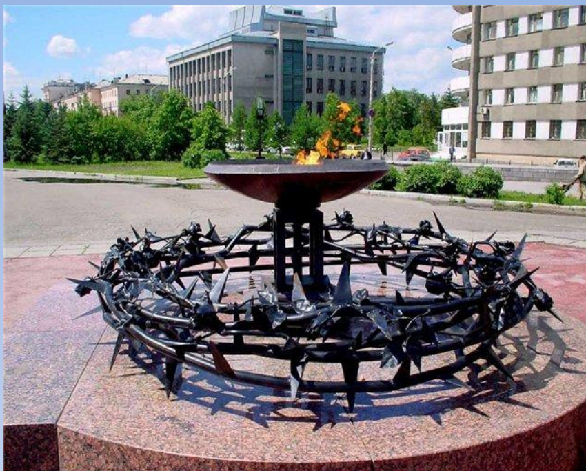
Мемориал памяти воинов, погибших в Афганистане. БАРНАУЛ