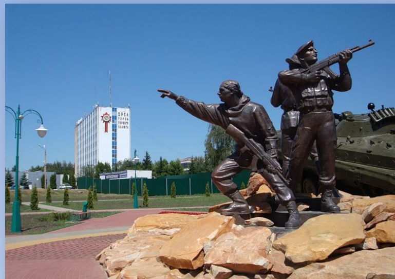
Памятник участникам военных конфликтов и локальных войн. г. Орел