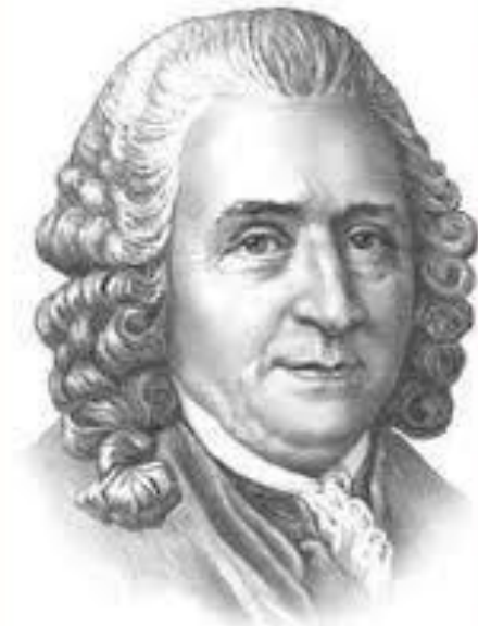
Карл Линней 1707-1778