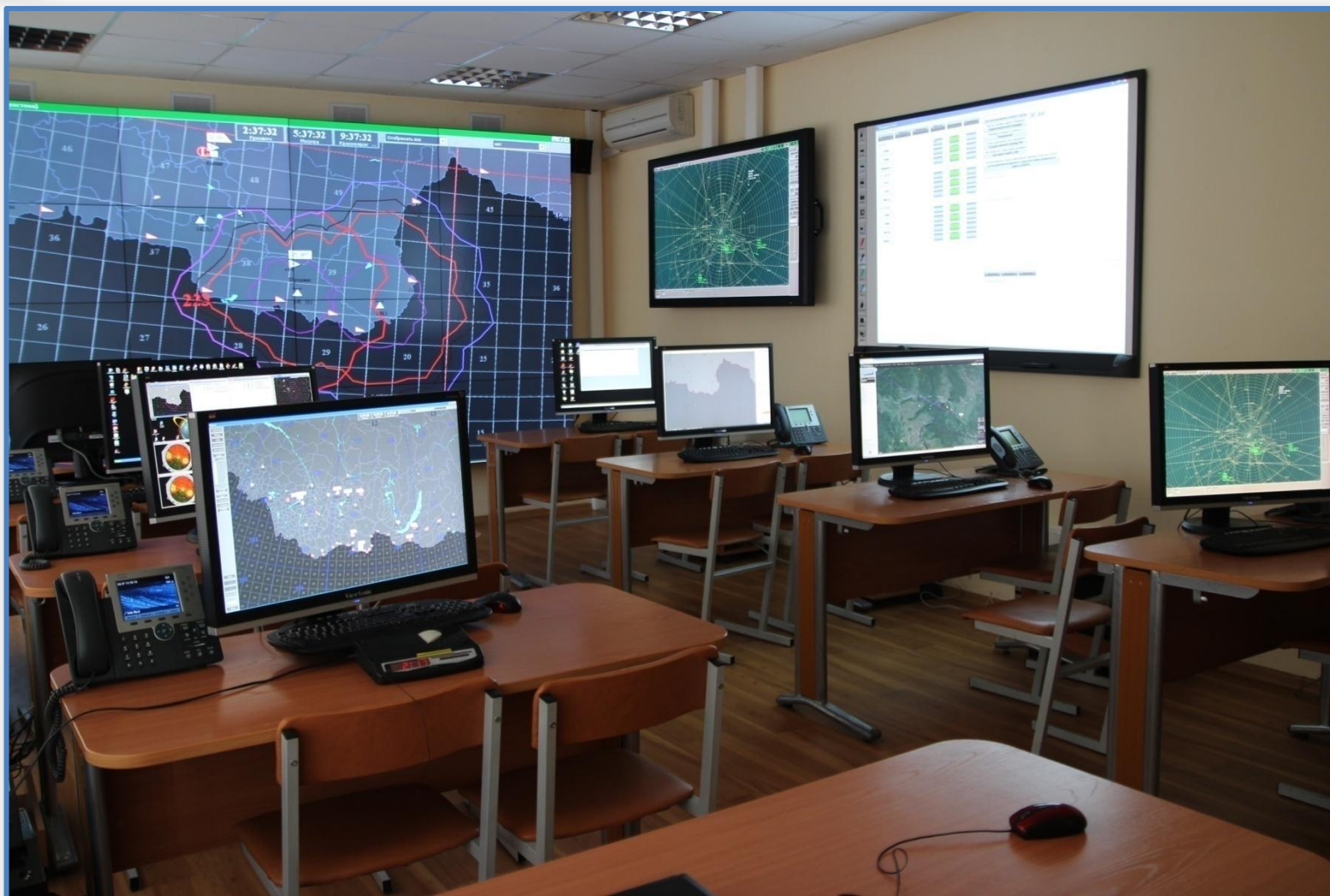
Учебный КП ртп