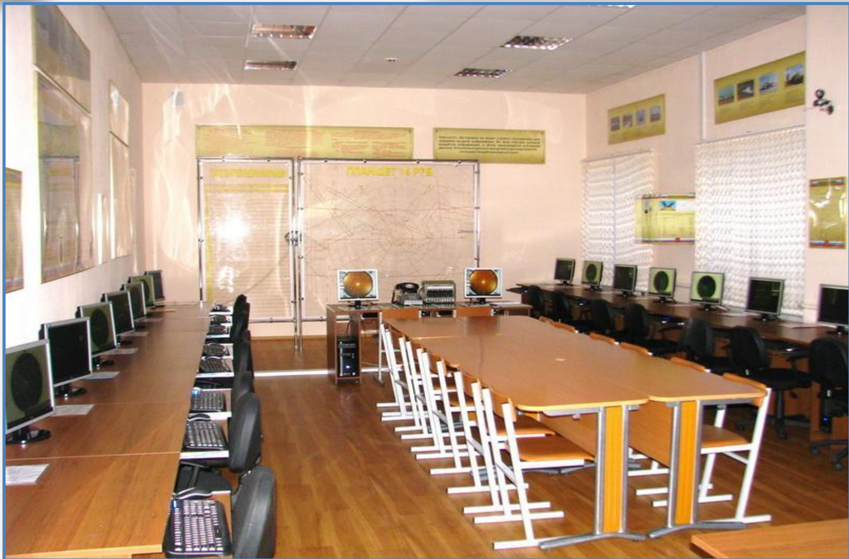
Класс тактики РТВ ВКС