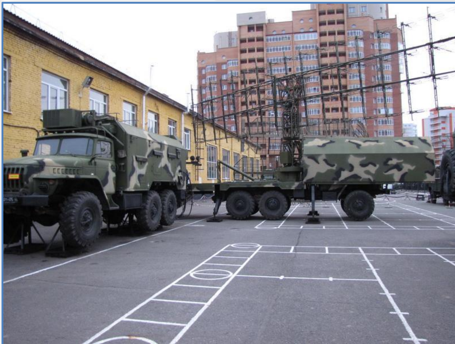
Изделие 1Л-13 (Небо СВ)

СИБИРСКИЙ ФЕДЕРАЛЬНЫЙ УНИВЕРСИТЕТ SIBIRIAN FEDERAL UNIVERSITY