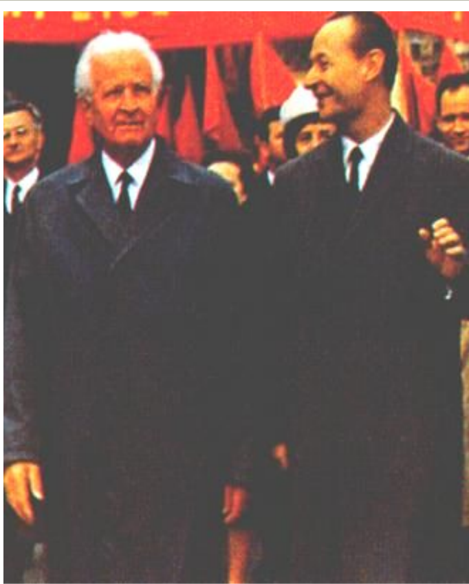
Л.Свобода и А.Дубчек.

В 1968 г. новое руководство КПЧ во главе с А.Дубчеком заявило о необходимости демократических преобразований. В апреле пленум ЦК принял план построения «социализма с человеческим лицом».