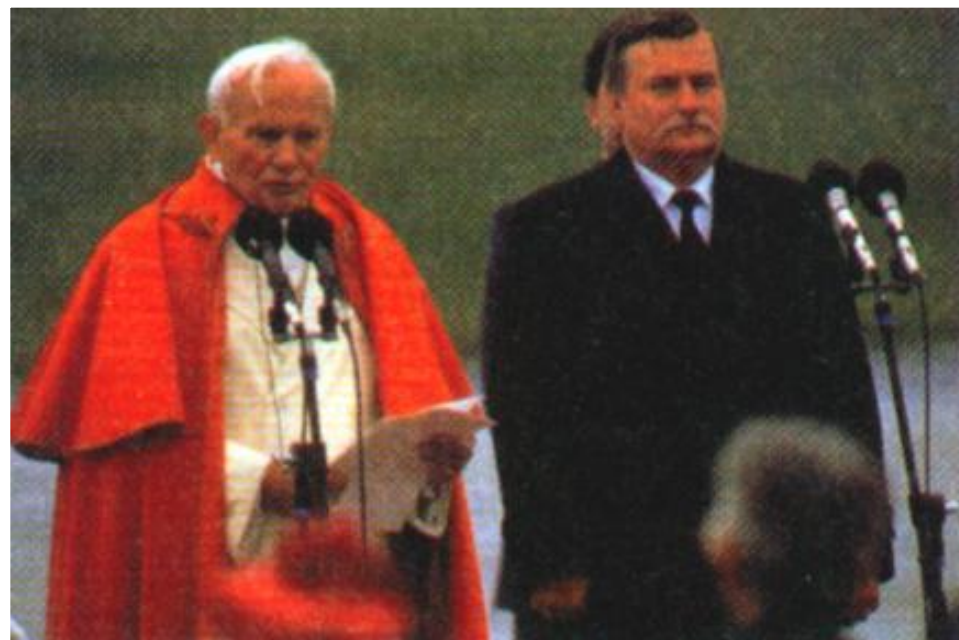
Лех Валенса и Иоанн Павел II

ПОРП тянула с проведением реформ, понимая, что если выборы состоятся, то она потеряет власть, ОВД введет в Польшу войска и могут начаться кровавые столкновения. В результате во главе правительства встал ген. В. Ярузельский. 13.12.1981 г. он ввел в стране военное положение. Сотни лидеров оппозиции были арестованы.