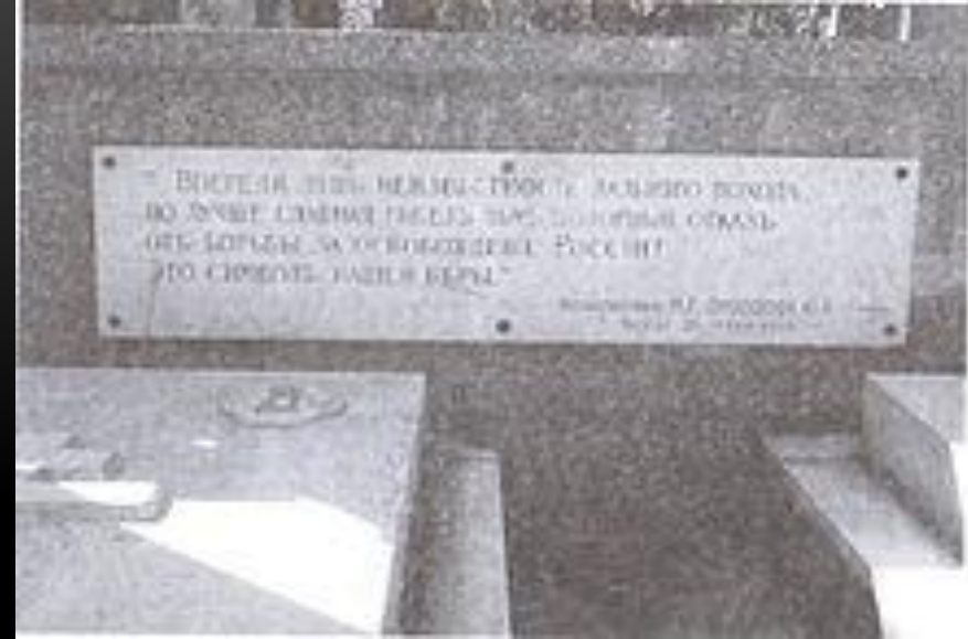
Памяти генерала М. Г. Дроздовского и дроздовцев. Сен-Женевьев-де-Буа

Памяти генерала М. Г. Дроздовского и дроздовцев, павших за Родину и на чужбине скончавшихся. Галлиполи