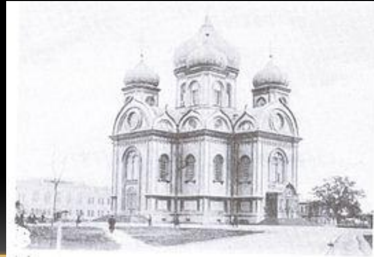
Кубанский войсковой собор Святого Александра Невского, где первоначально был похоронен М. Г. Дроздовский

Памяти генерала М. Г. Дроздовского и дроздовцев, павших за Родину и на чужбине скончавшихся. Галлиполи