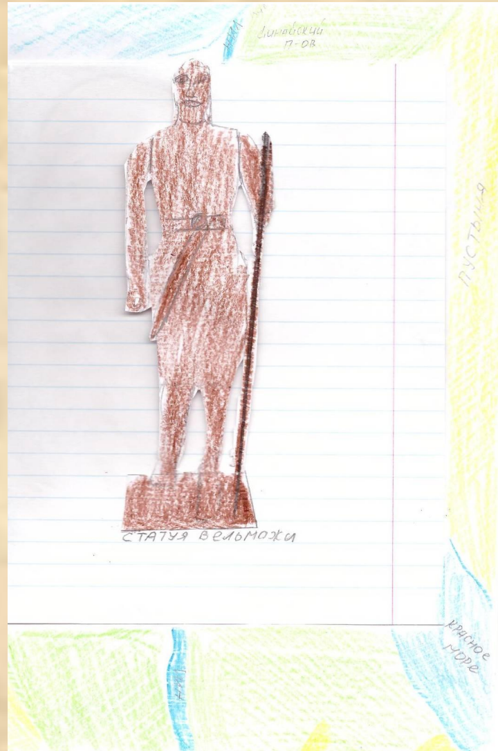
Рисунки Димы Бажанова