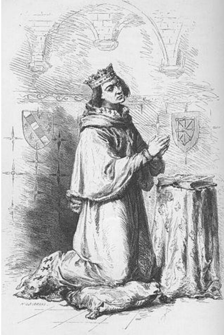
Карл Злой. Худ. А. де Невиль.

Стремясь ослабить дофина, Генеральные Штаты освободили из плена претендента на престол Франции – наваррского короля Карла Злого .