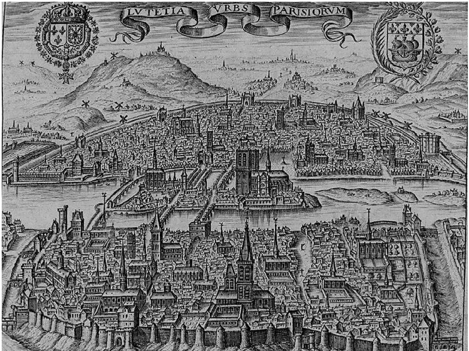
Париж в эпоху Карла V