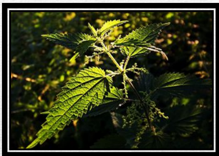
Жалица – крапива