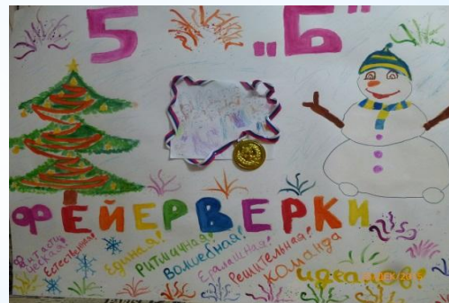
Плакат на Новый год от нашего класса с названием команды