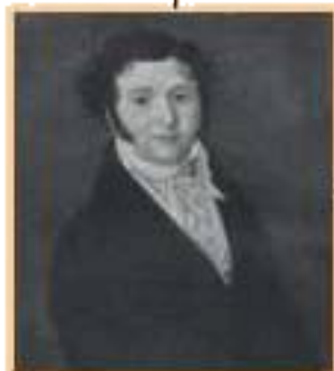
Ю.П.Лермонтов - отец