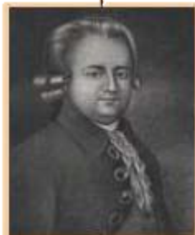
П.Ю. Лермонтов - дед