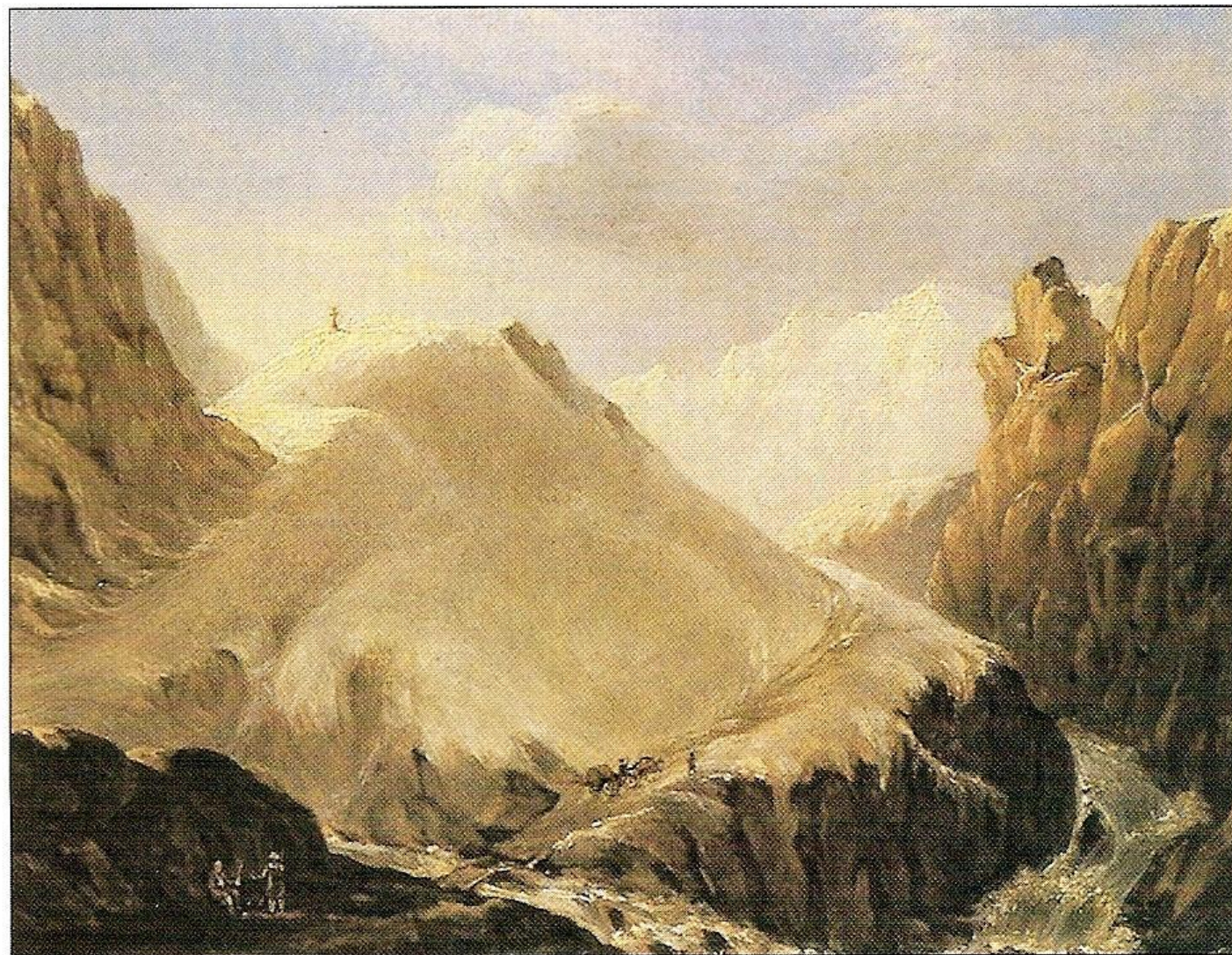
М.Ю.Лермонтов. Крестовая гора. 1837—1838