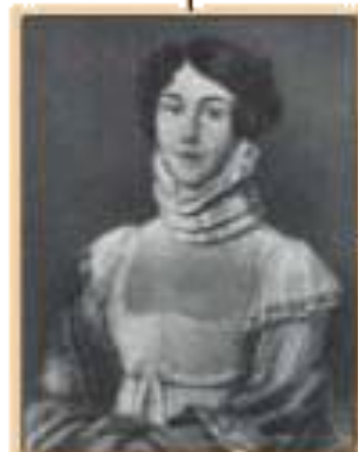
М.М.Лермонтова - мать