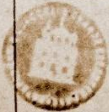
«Выпись из метрической книги» Пятигорского Спасского собора