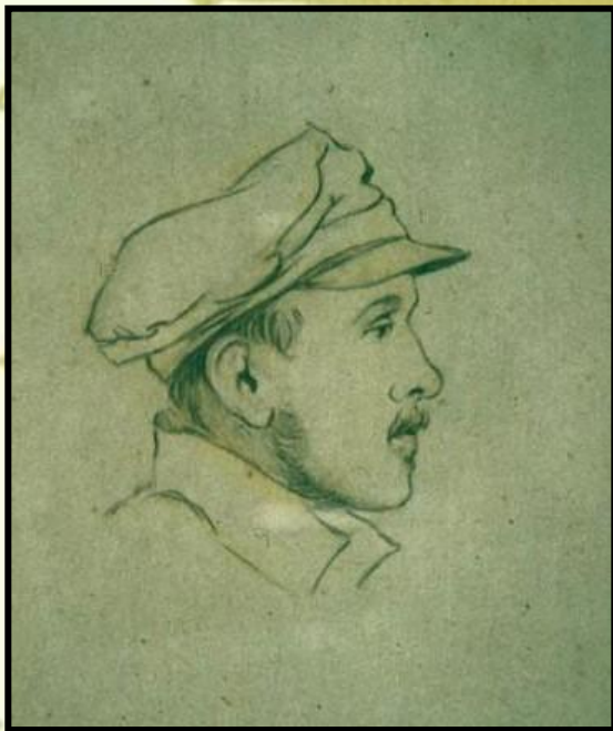
М.Ю. Лермонтов 1814-1841