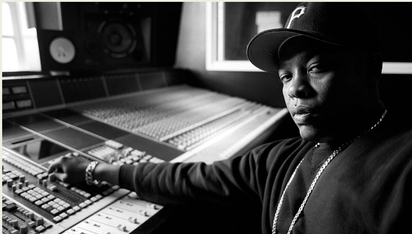
Dr. Dre за работой