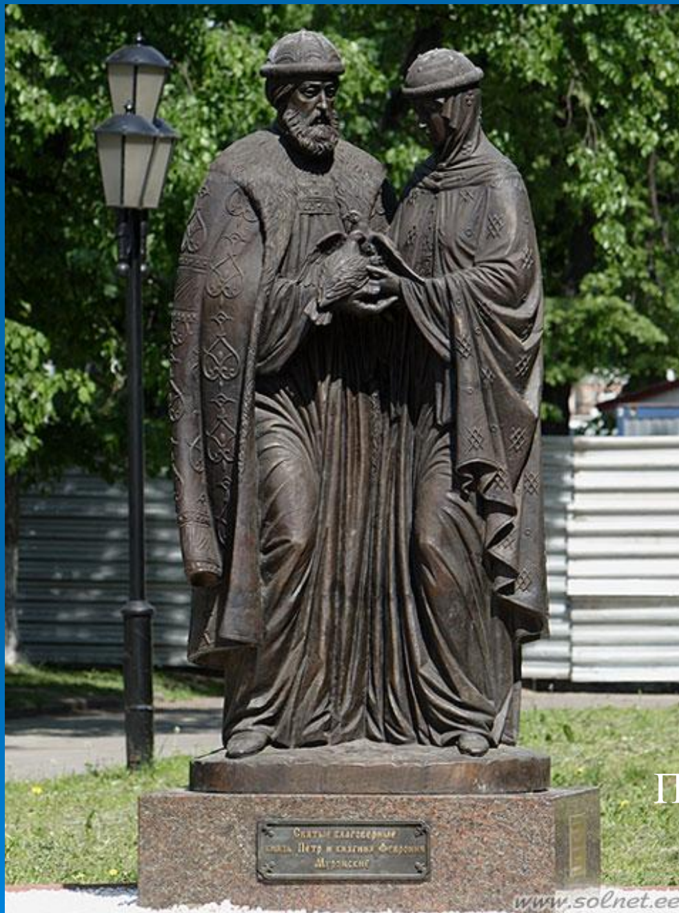
Петр и Феврония, г. Ярославль