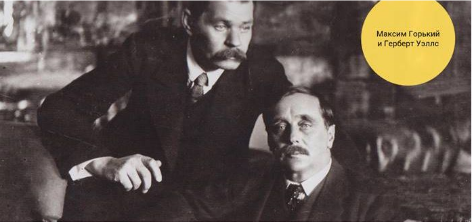
Максим Горький и Герберт Уэллс