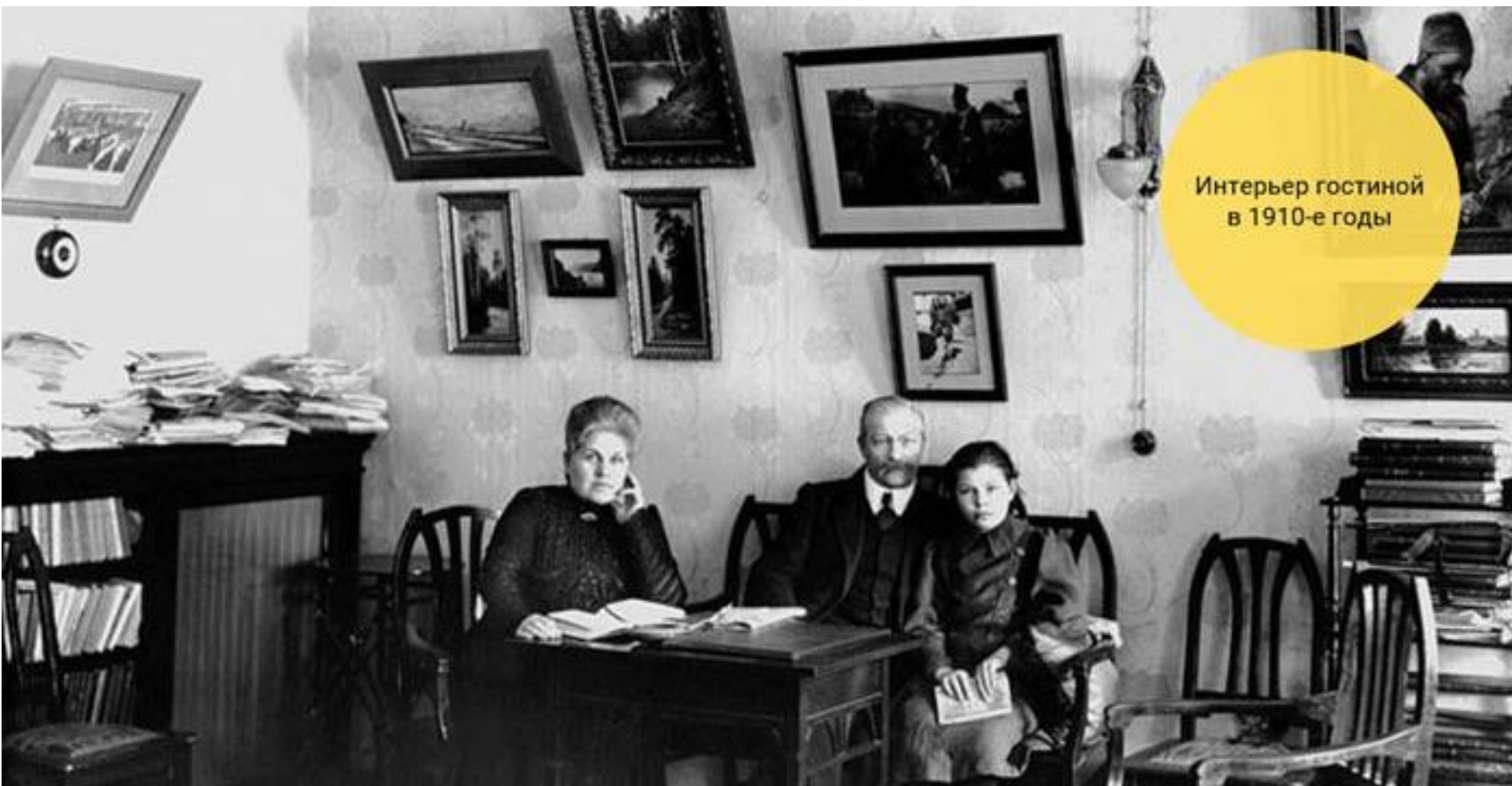
Интерьер гостиной в 1910-е годы