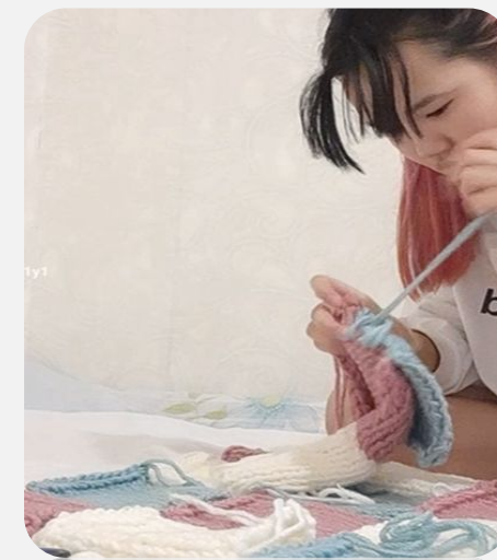
3. Сшивание отдельных частей