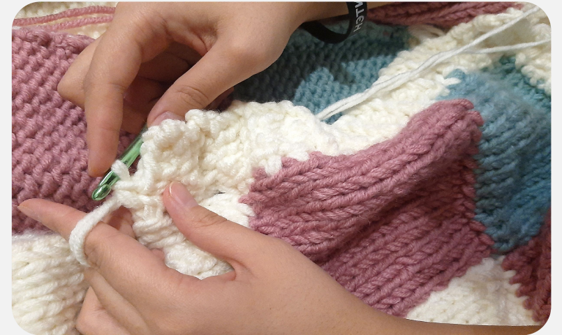
5. Вязка резинки и манжеток