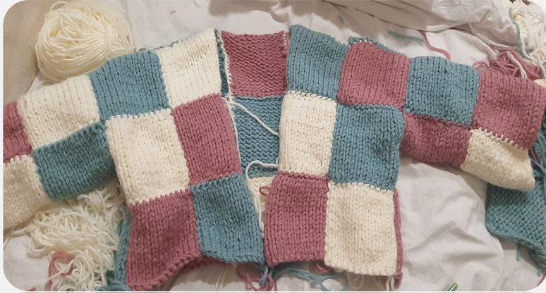
4. Соединение всех частей в одно целое