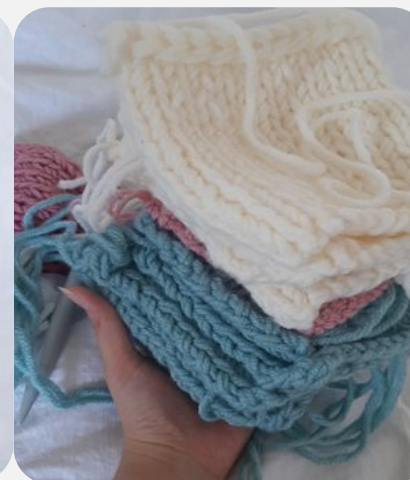
2. Вязание квадратов