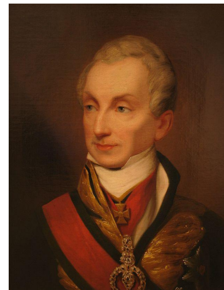
Австрийски й канцлер Меттерних