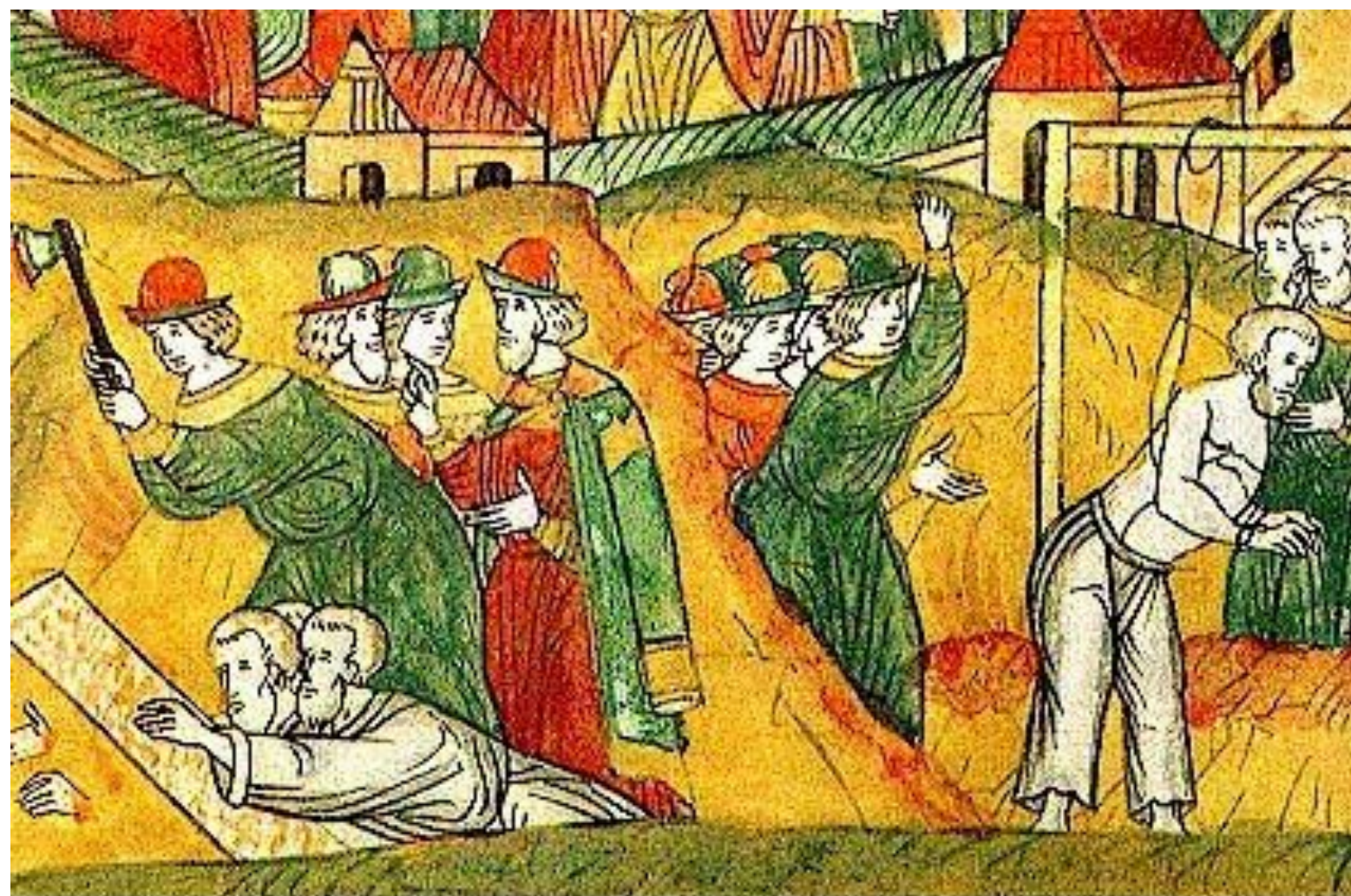
Казнь участников мятежа Андрея Старицкого - противника самодержавной власти 1537 г. Миниатюра летописного свода XVI в.