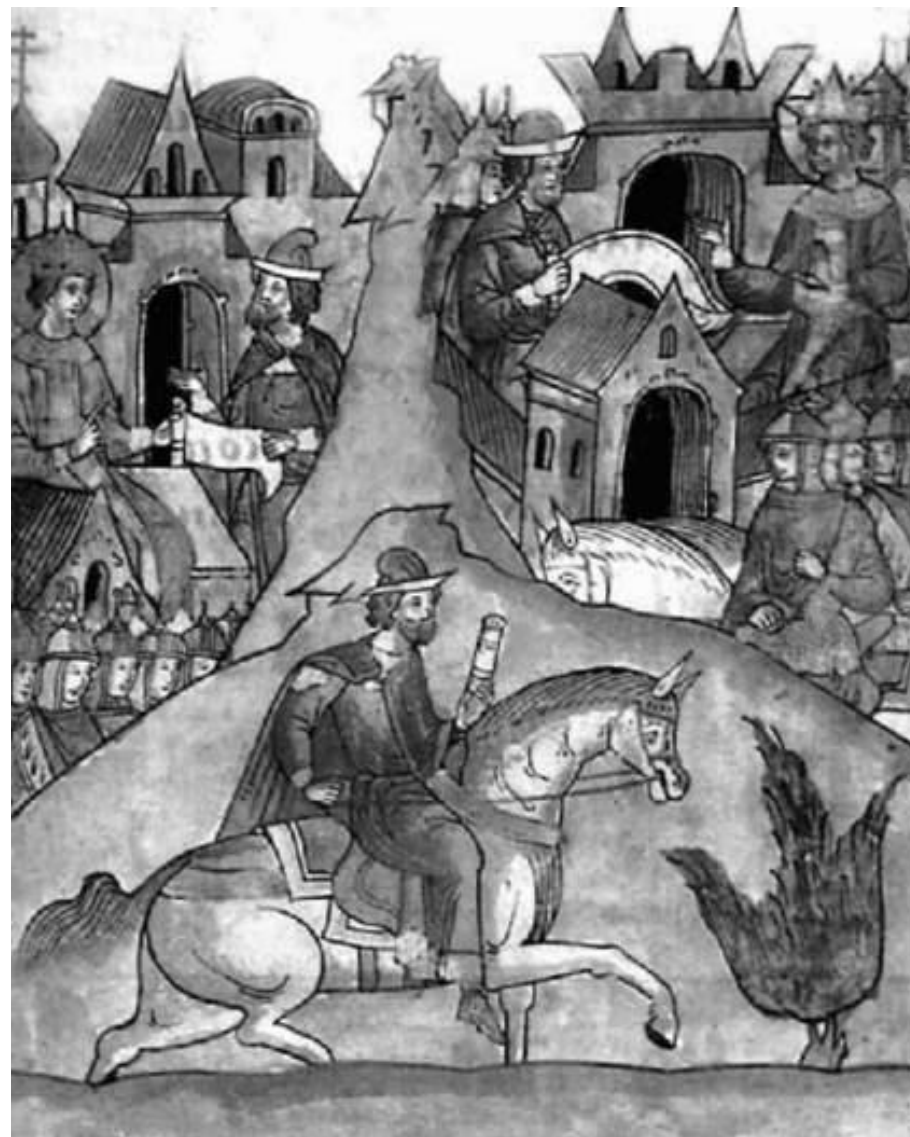
Гонец. Миниатюра из Лицевого свода XVI в.