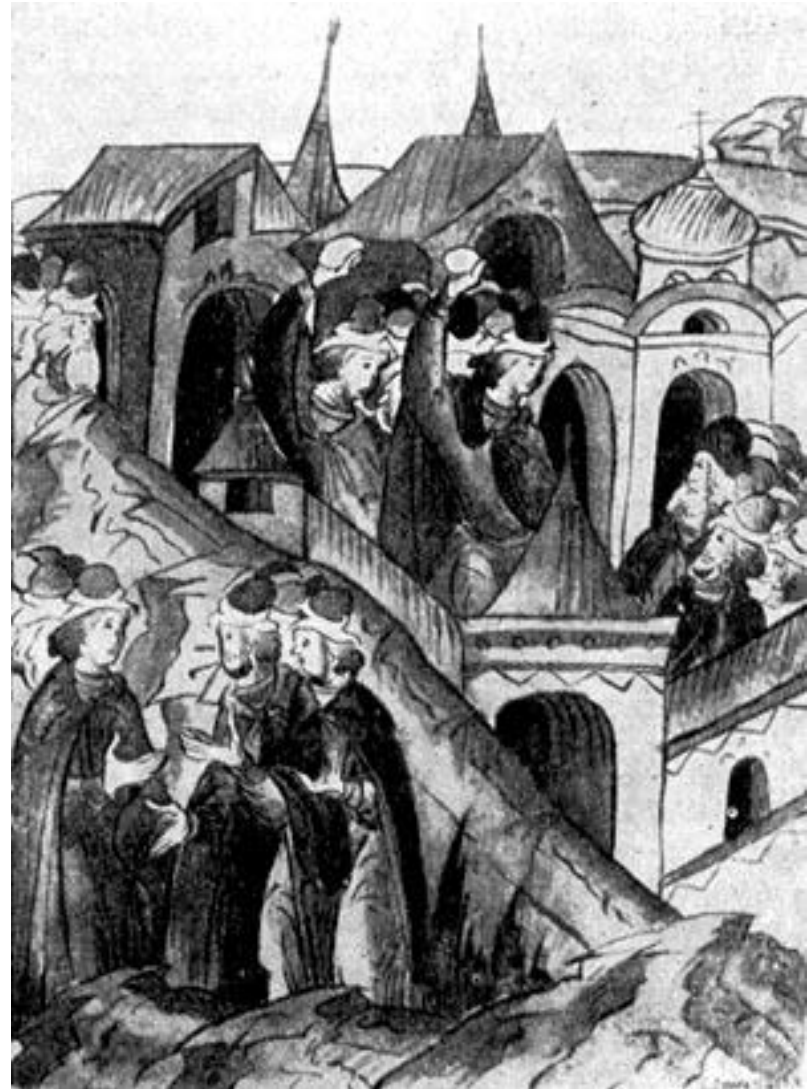
Восстание в Москве в 1547 г. Миниатюра из Лицевого свода. XVI в.