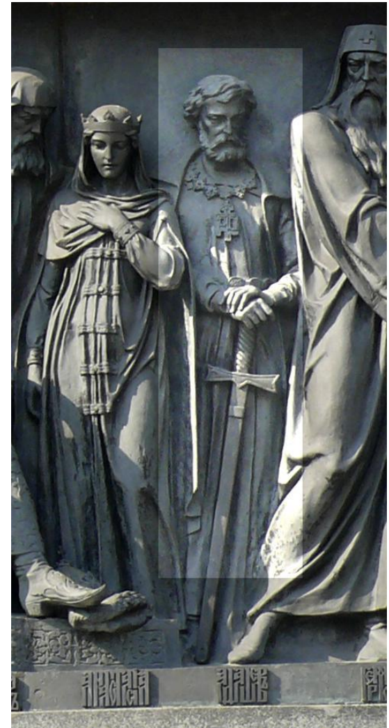
А. Ф. Адашев на Памятнике «1000-летие России» в Великом Новгороде