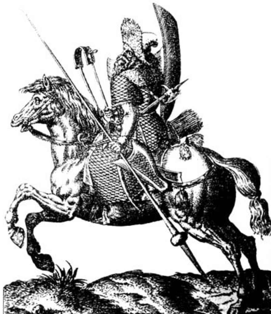
Московский конный воин середины XVI в.