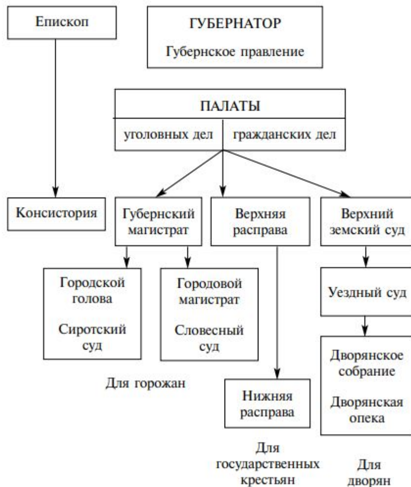
СУДЕБНЫЕ УЧРЕЖДЕНИЯ ГУБЕРНИИ И УЕЗДА В КОНЦЕ XVIII в.

Суть: Сенат стал главным судебным и административным органом. Он был разделён на 6 департаментов, каждый из которых выполнял свои функции.