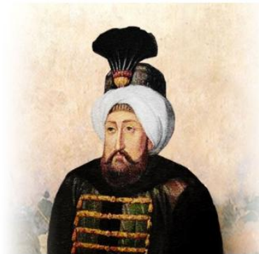
Крымский Хан Гирей IV