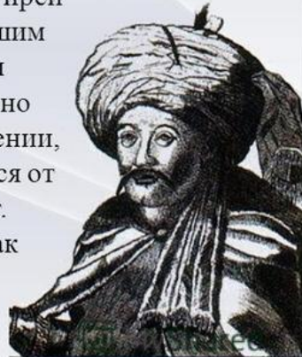
Selim Giray Khan, 1700. Engraving by...

Единственной правящей династией Крымского ханства стала династия Гиреев. Основателем династии был первый хан Крыма Хаджи I Гирей, в результате долгой борьбы добившийся независимости Крыма от Золотой орды. Интересен факт, что 44 крымских хана правили 56 раз. Такое несоответствие связано с тем, что один и тот же крымский хан мог терять престол, а потом вновь занимать его. К примеру, Каплан-Гирей I и Мен-гли-Гирей I возводились на престол трижды, а Селим-Гирей – четырежды. Такая ситуация была вызвана большим влиянием Османской империи на назначение и смещение ханов. Часто падишаху было достаточно послать будущему хану подарок и приказ о назначении, и прежний правитель без лишнего ропота отрекался от престола. Крайне редко хан правил более 5 лет. Низложенные правители Крымского ханства, как правило, отсылались на Родос.