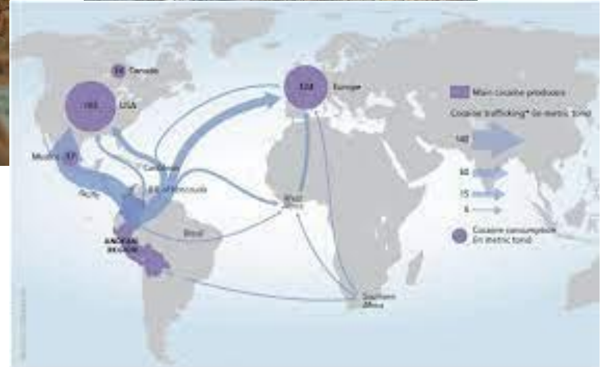
Незаконный экспорт наркотиков на другие страны