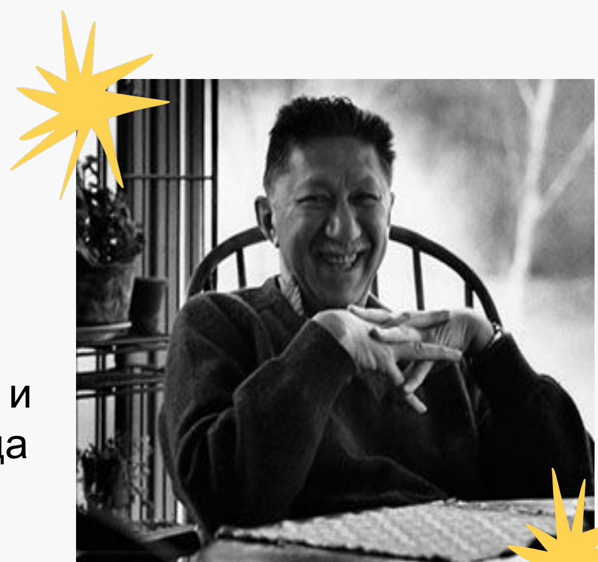
Абрахам Х. Маслоу

В 1930 году он закончил Университет Висконсина, получив степень бакалавра по психологии, затем магистра гуманитарных наук в 1931 году и доктора в 1934 году.