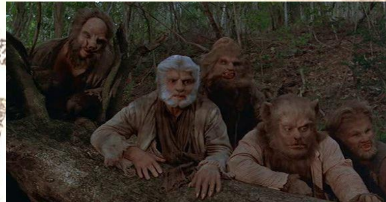
Остров доктора Моро