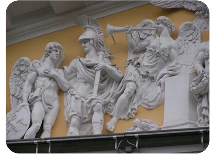
Горельеф (фр. haut-relief — высокий рельеф) — разновидность скульптурного выпуклого рельефа, в котором изображение выступает над плоскостью фона более чем на половину объёма изображаемых частей.

Также выделяются некоторые специфические виды этого искусства: миниатюрная скульптура, кинетическая, ледяная, парковая и другие. По жанру скульптура бывает портретной, бытовой, исторической, символической.