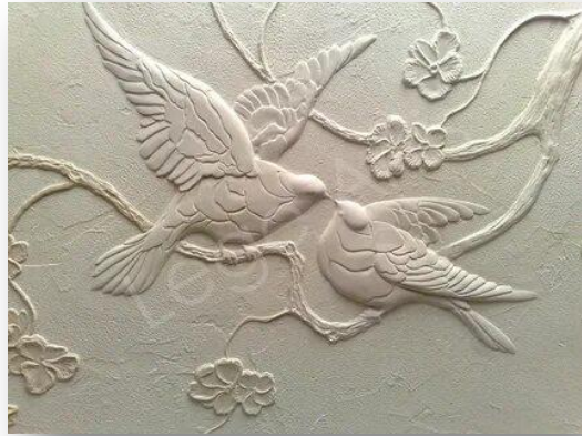
Барельеф (фр. bas-relief «низкий рельеф») — разновидность скульптурного выпуклого рельефа, в котором изображение выступает над плоскостью фона не более, чем на половину объёма