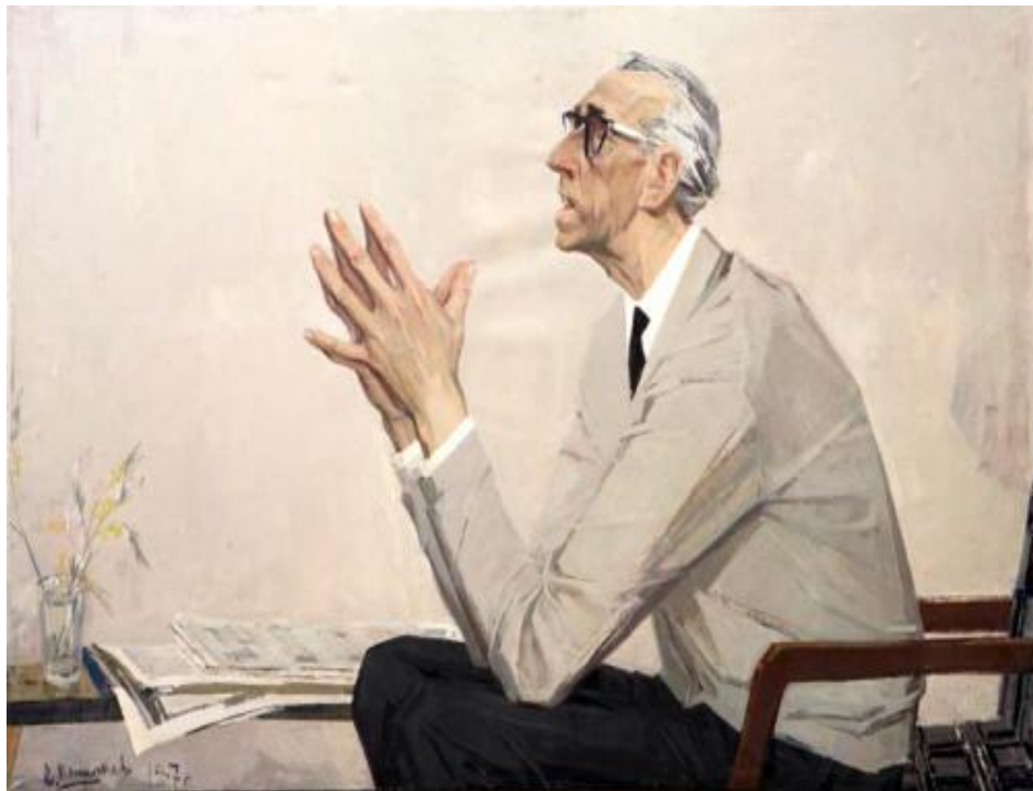
Портрет Д. Кабалевского 1971год