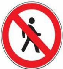
«Движение пешеходов запрещено»