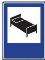
«Гостиница или мотель»