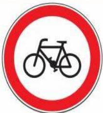
«Движение на велосипедах запрещено»