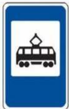
«Место остановки трамвая»