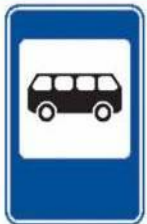
«Место остановки автобуса и (или) троллейбуса»