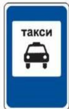
«Место стоянки легковых такси»