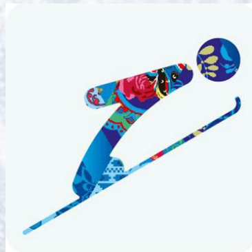
Прыжки с трамплина