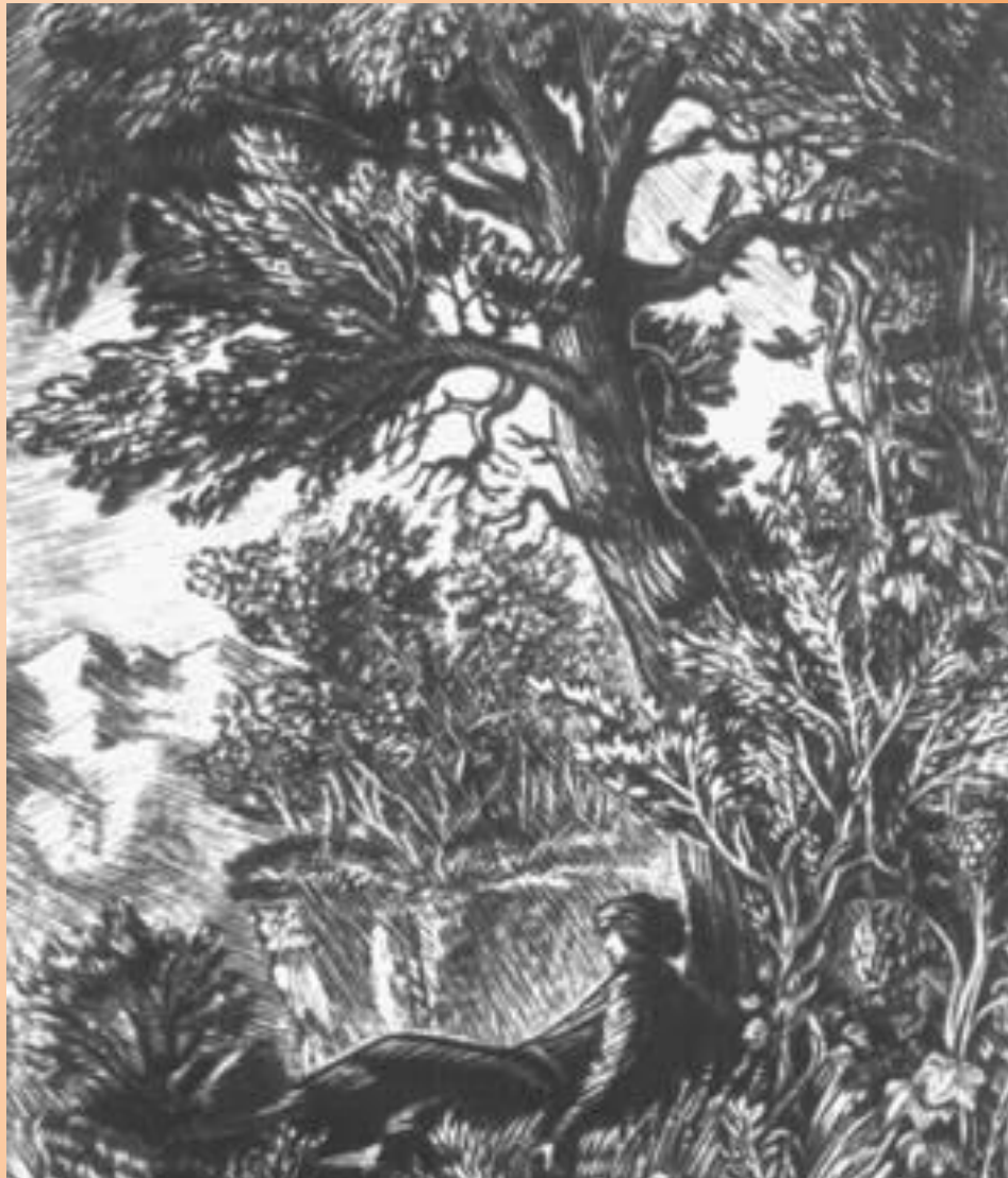
Художник- иллюстратор- Ф.Д.Константинов «Мцыри, любующийся горами»