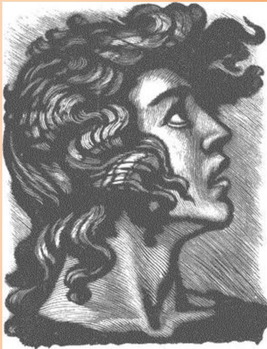
Художник- иллюстратор- Ф.Д.Константинов « Голова Мцыри»