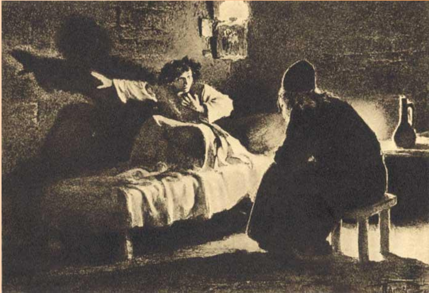
Художник- иллюстратор- Л.О.Пастернак « Исповедь Мцыри »