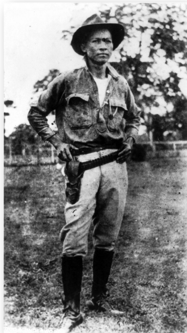
Аугусто Сесар Сандино