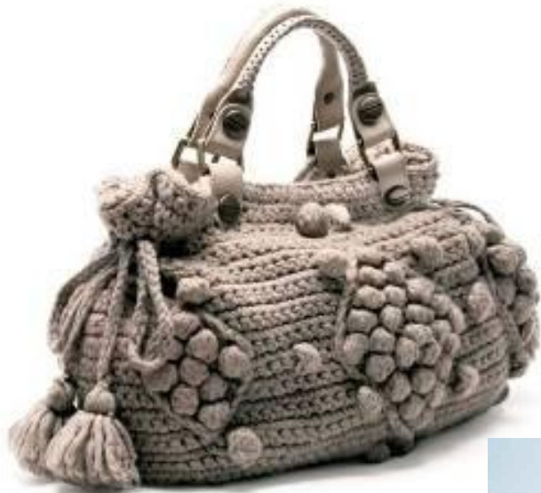
Sac "24 heures" Dublin à pompons, tricoté main. @berthabouffeur.