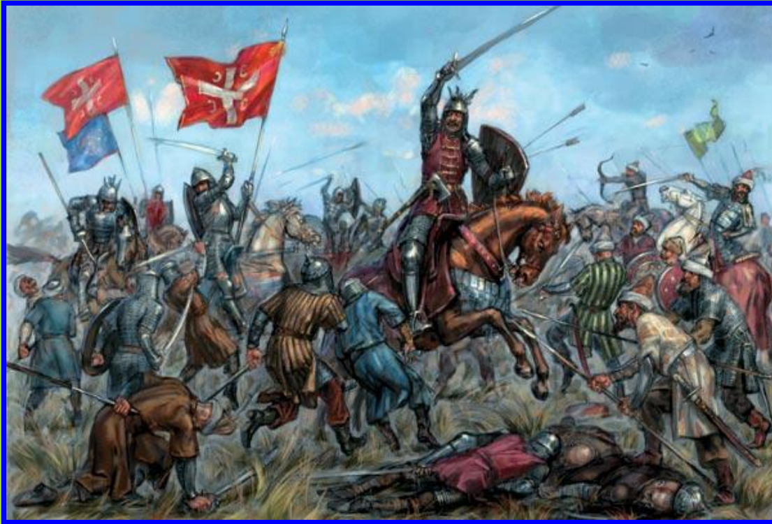
Битва на Косовом поле