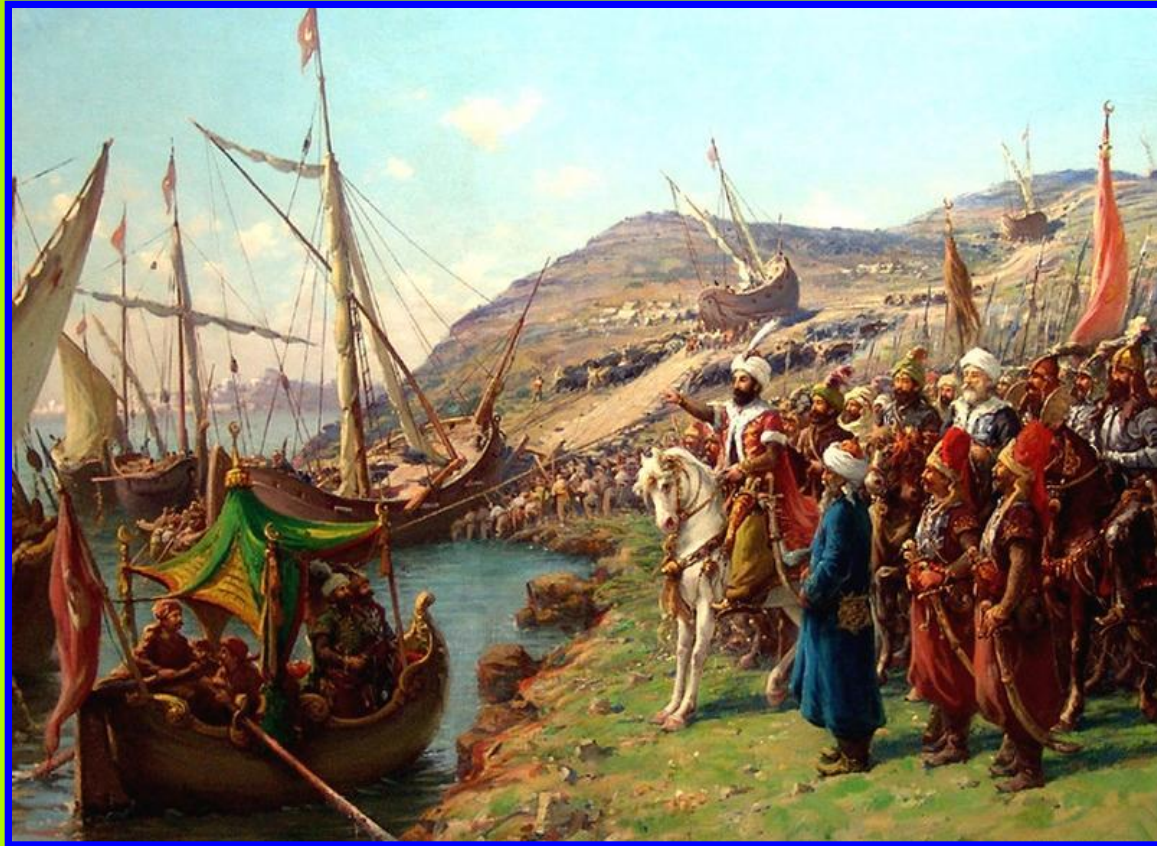
Султан Мехмет II

В 1453 г. турецкий султан Мехмет II собрал огромную армию (до 150 тыс.чел.) и осадил Константинополь. Император Константин смог выставить на защиту города лишь около 7 тыс.человек (большинство наемники).