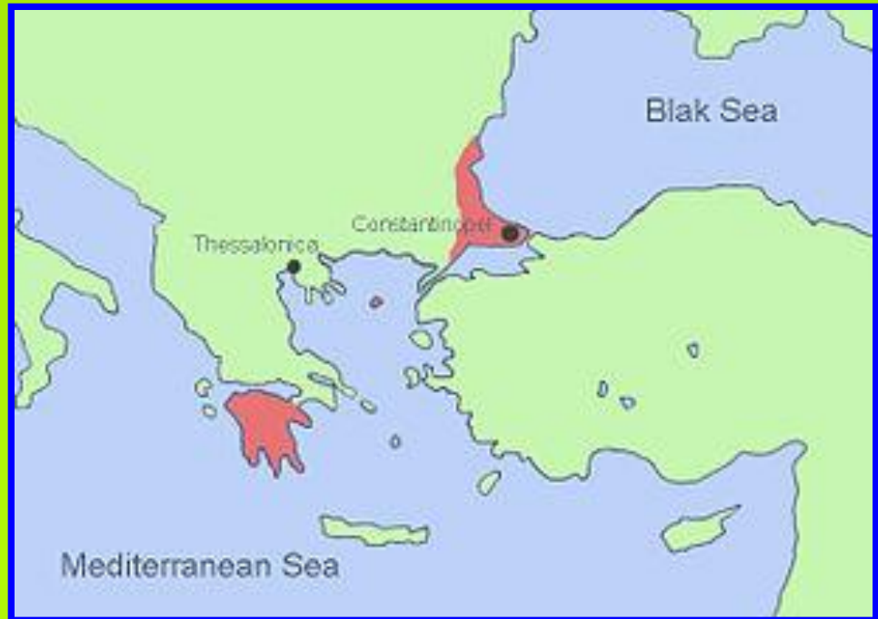
Византия к 1450 г.

К середине XV века Византия потеряла все свои владения. Император владел только городом Константинополь и небольшими территориями в Греции. Жители Византии были недовольны заключенной с католиками унией и не поддерживали власть императора.