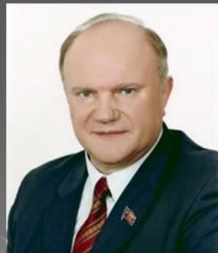
Г.А.Зюганов – председатель КПРФ

? Вспомните основные положения программы КП СССР. Сравните с программой КП РФ