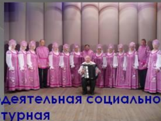
Самодеятельная социально-культурная организация