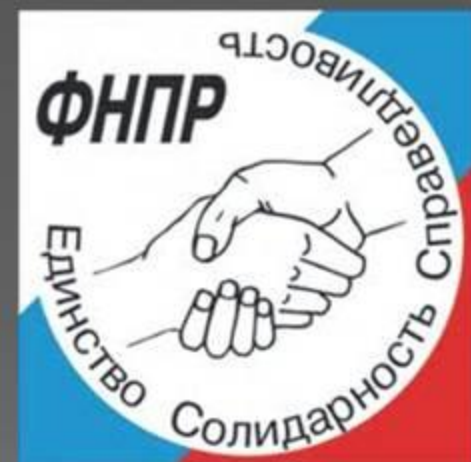
Символика ФНПР (от 1990)

В начале 90-х годов профсоюзные организации заявили о себе достаточно громко. Наиболее часто использовались забастовки, митинги, демонстрации, манифестации, пикеты. Профсоюз горняков в 1989 году стал зачинщиком шахтерского движения, потрясшего устои советского строя. Но популярность профсоюзов быстро упала, из-за их неопределенности в системе распределения общественной власти.