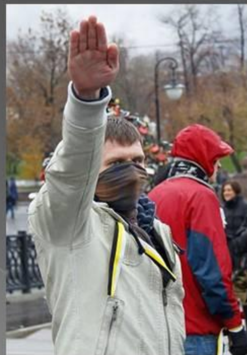
Представитель неонацистского движения

Приведите примеры деятельности молодёжных организаций 90-х годов.