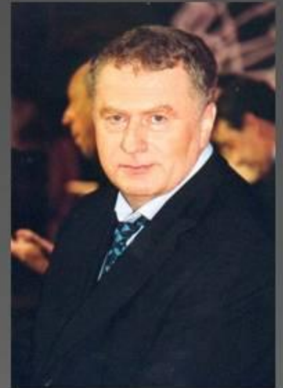
В.В.Жириновский – лидер и основатель ЛДПР

Программной целью провозглашалось построение европейского индустриального общества на базе рыночной экономики; борьба за отстранение КПСС от власти, сохранение единой государственности.