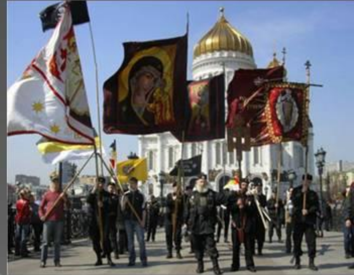
Марш Русского национального единства