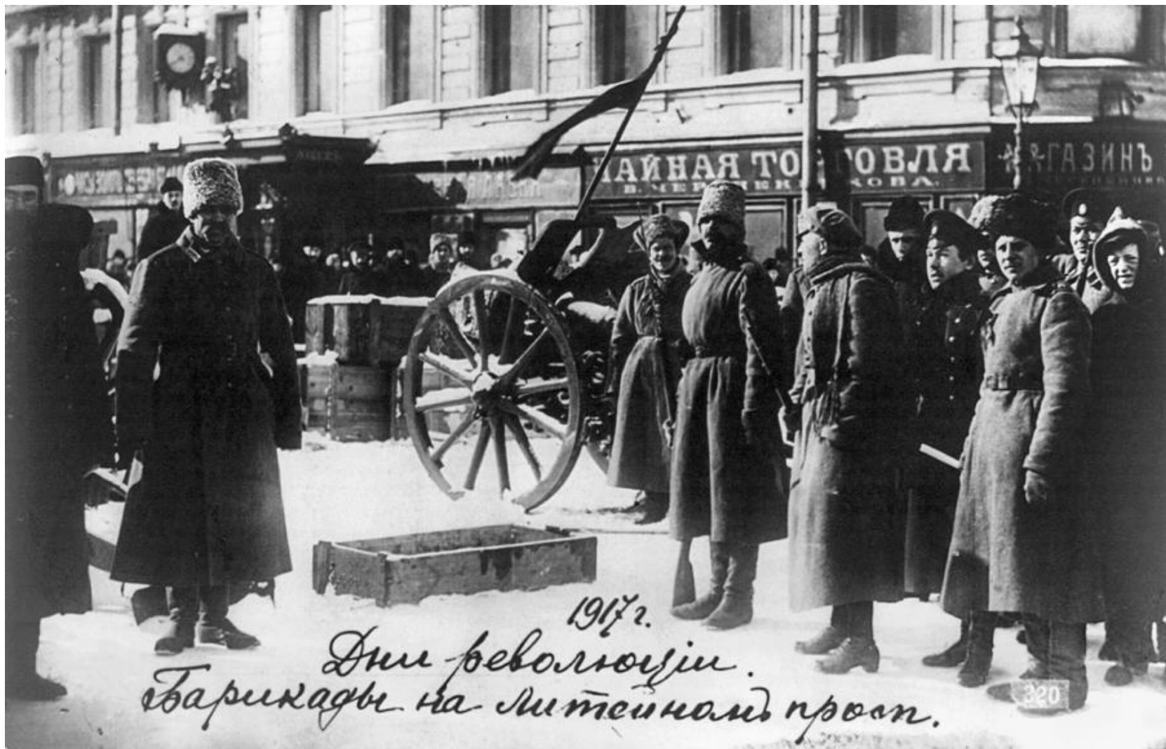
1917 г. Дни революции. Баррикады на Митейном проезде.