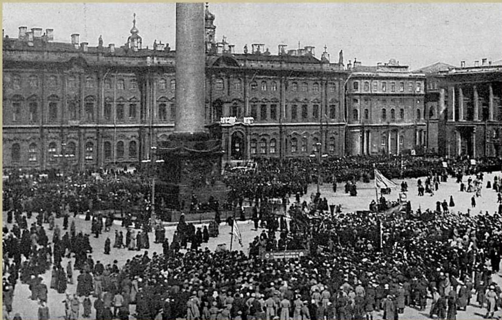
Демонстрация у Зимнего Дворца, превращенного в госпиталь.