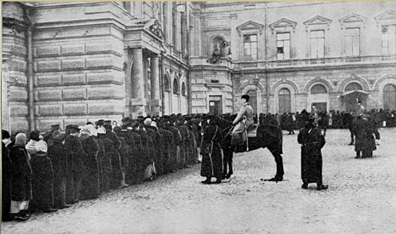
Очередь за хлебом, охраняемая полицией...

Продовольственный кризис: Карточки во многих городах, паника, слухи... У хлебных лавок выстроились длинные очереди — «хвосты»,