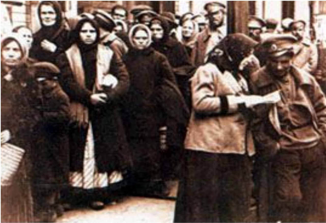
Очередь у продовольственного магазина. Петроград. 1917 г.

2.В феврале в центральной России ударили сильные морозы до минус 43 ° . Это привело к выходу из строя свыше 1200 паровозов, часть поездов застряла из-за снежных заносов