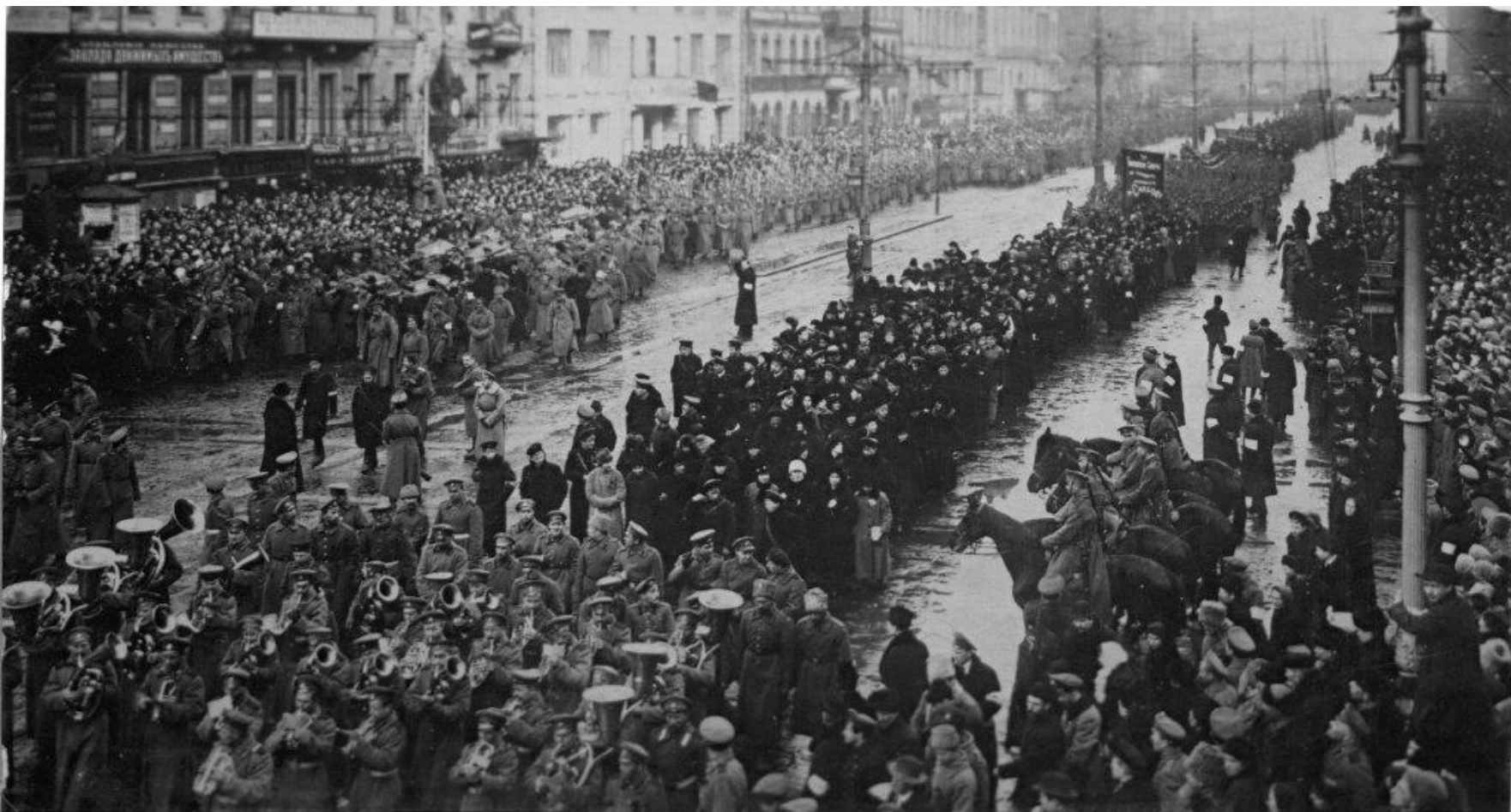
30 Всенародная похороны жертвъ павшихъ за свободу 23-го Марта 1917 г. въ Петроградѣ.