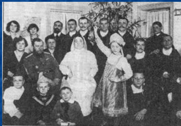
Дети Ф.И. Шаляпина организовали концерт для раненых