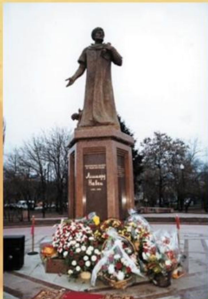
Памятник поэту в Москве