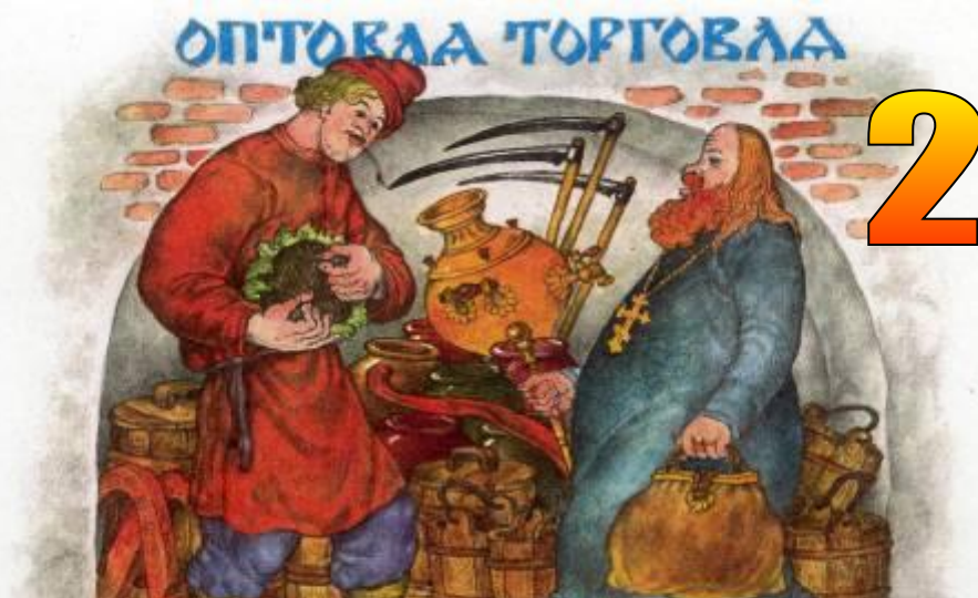
«Сказка о попе и о работнике его Балде»