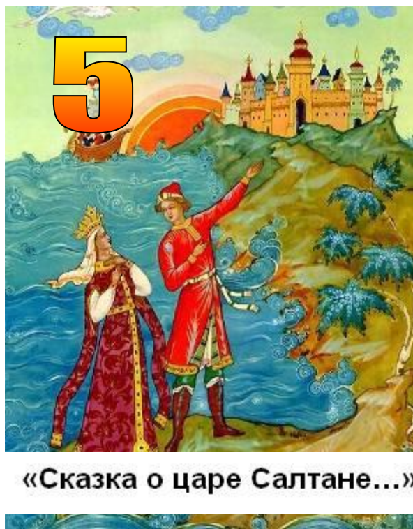
«Сказка о царе Салтане...»