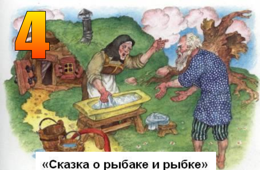
«Сказка о рыбаке и рыбке»