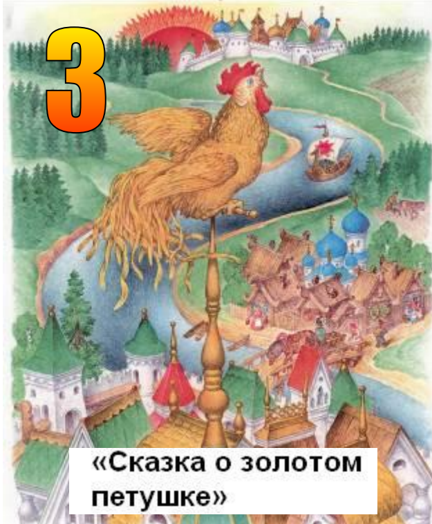
«Сказка о золотом петушке»