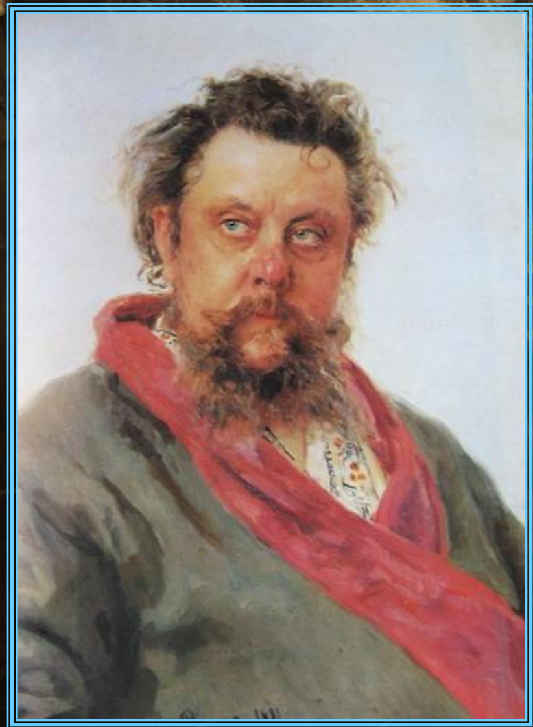
И.Е. Репин. Портрет композитора М. Мусоргского

По словам Стасова, биография Мусоргского коротка, печальна, безотраднa, как почти у всех лучших талантов той эпохи.