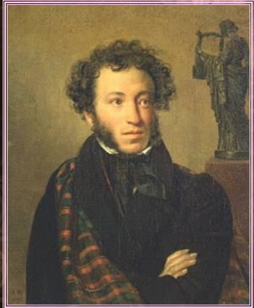
О. Кипренский. Портрет поэта А.С. Пушкина