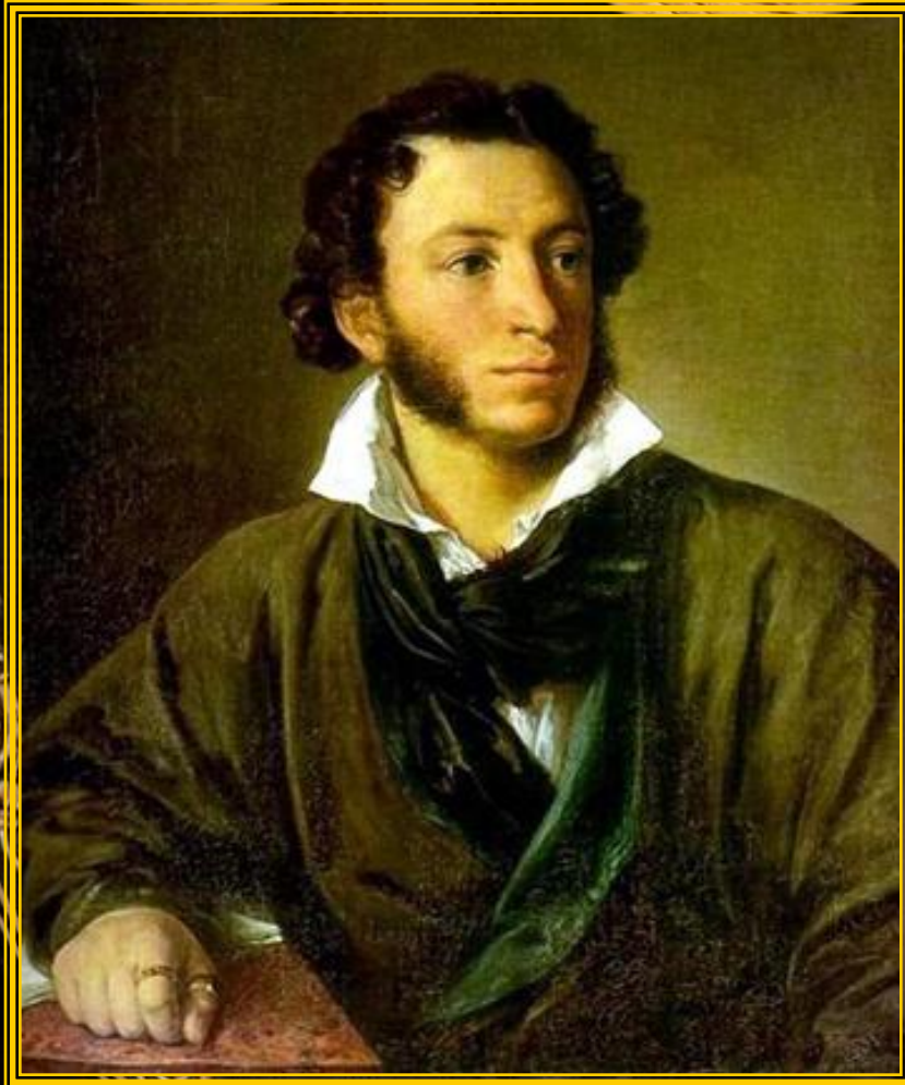
Тропинин Портрет поэта А.С. Пушкина