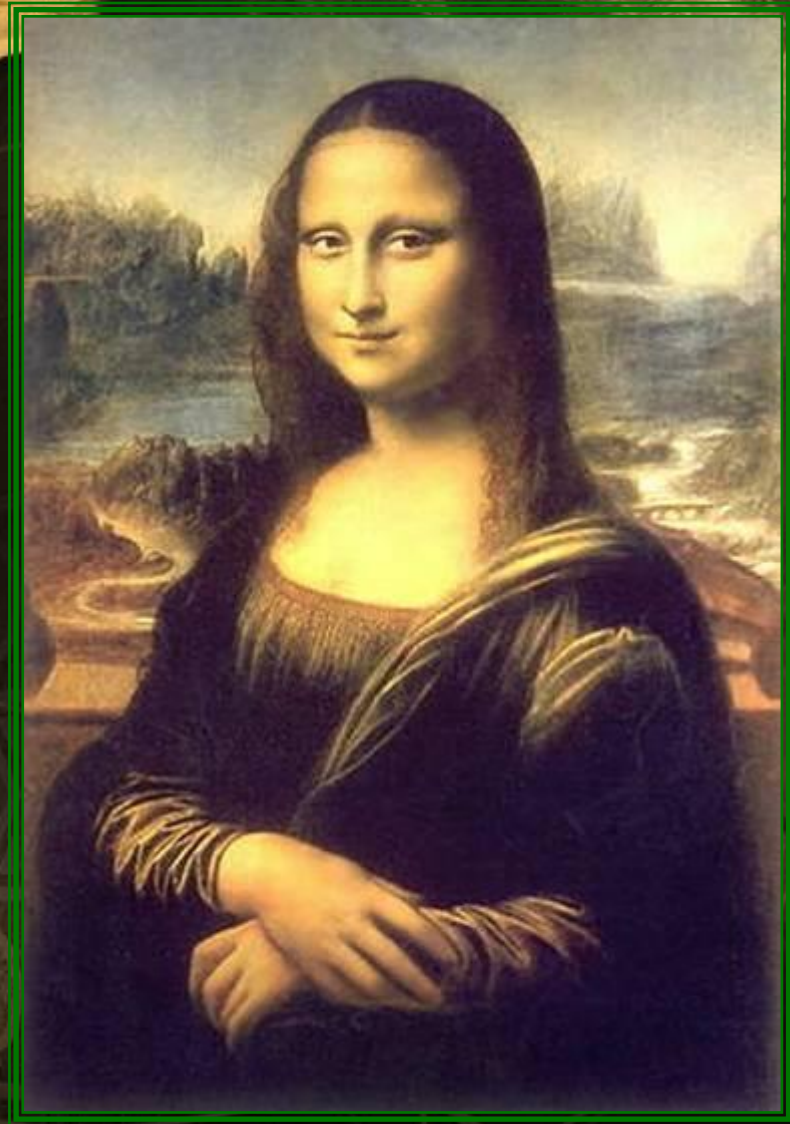
Леонардо да Винчи. Мона Лиза (Джоконда)