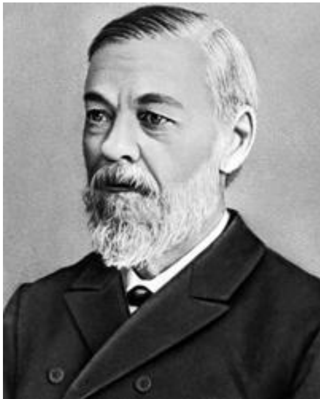
И. М. Сеченов