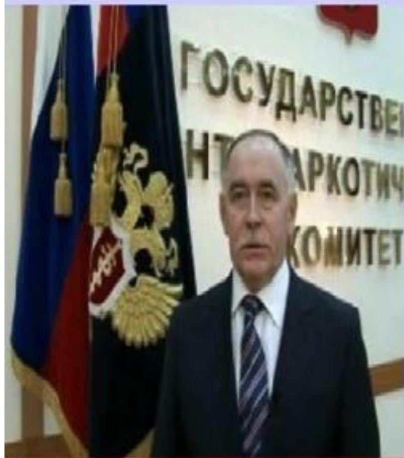
Директор ФСКН с 15 мая 2008 года — Виктор Петрович Иванов

24 сентября 2002г создан Государственный комитет по противодействию незаконному обороту наркотических средств и психотропных веществ при Министерстве внутренних дел Российской Федерации.