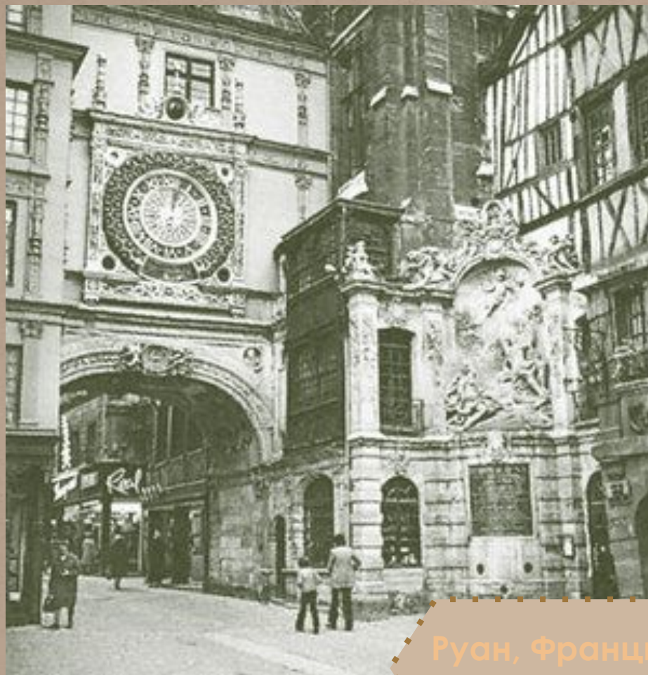
Руан, Франция. Часы, идущие с 1389 года.