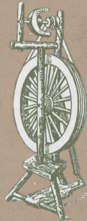
Первые колёсные прялки