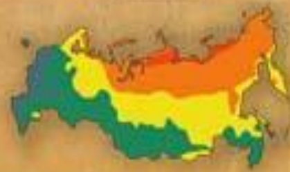
СТЕПЕНЬ БЛАГОПРИ- ЯТНОСТИ ПРИРОДНЫХ УСЛОВИЙ ЖИЗНИ НАСЕЛЕНИЯ